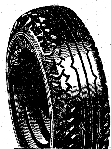
LA OBRA MAESTRA DE LOS NEUMÁTICOS

RECORDAMOS a los CONSUMIDORES de NEUMÁTICOS "FIRESTONE-HISPANIA", que TIENEN DERECHO durante todo el presente mes de noviembre, AL REGALO DE UNA famosa CAMARA roja, REFORZADA, de fabricación nacional, POR CADA CUBIERTA "FIRESTONE-HISPANIA" de igual medida, también nacional, QUE COMPREN.