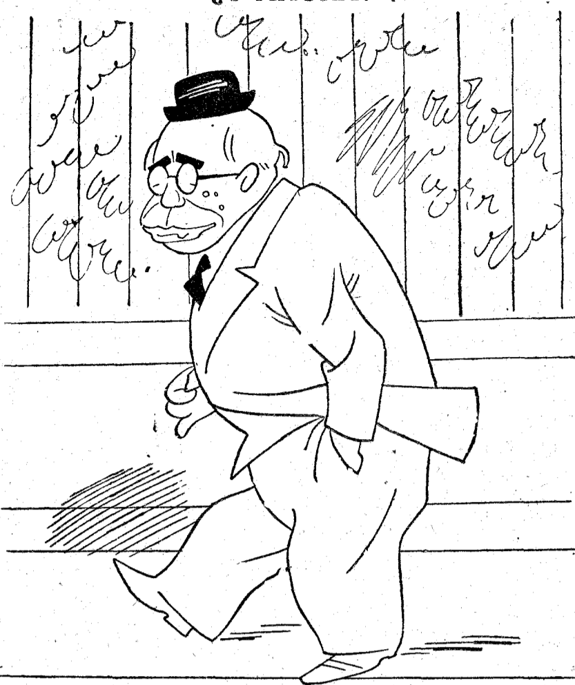
—Me está bien empleado. ¡Si cuando fui ministro de la Guerra me hubiera acogido al retiro de Azafía...!