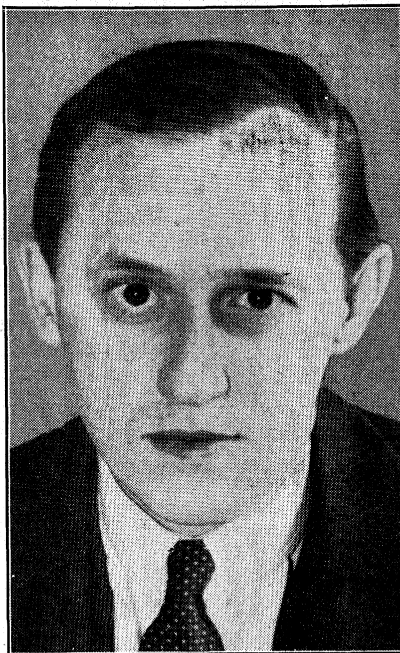
Mr. Henry L. Hopkins, administrador de la Reserva Federal, que ha sido encargado de remediar el paro en Norteamérica, como consecuencia de la puesta en práctica del nuevo programa