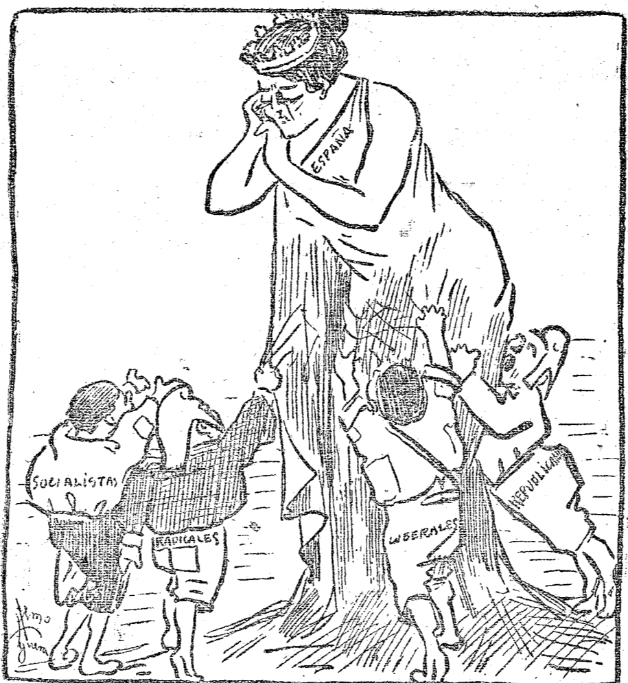
LA MADRE. - Pero, niños, ¿qué más queréis? LOS NIÑOS. - ¡Tragar!