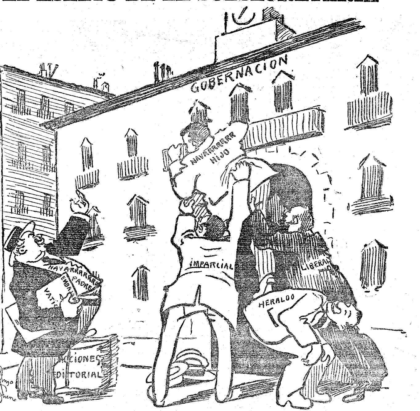
MAYOR REVERTER.—Empujenle, y si no llegan, aquí tengo unos papelotes para que se suban.