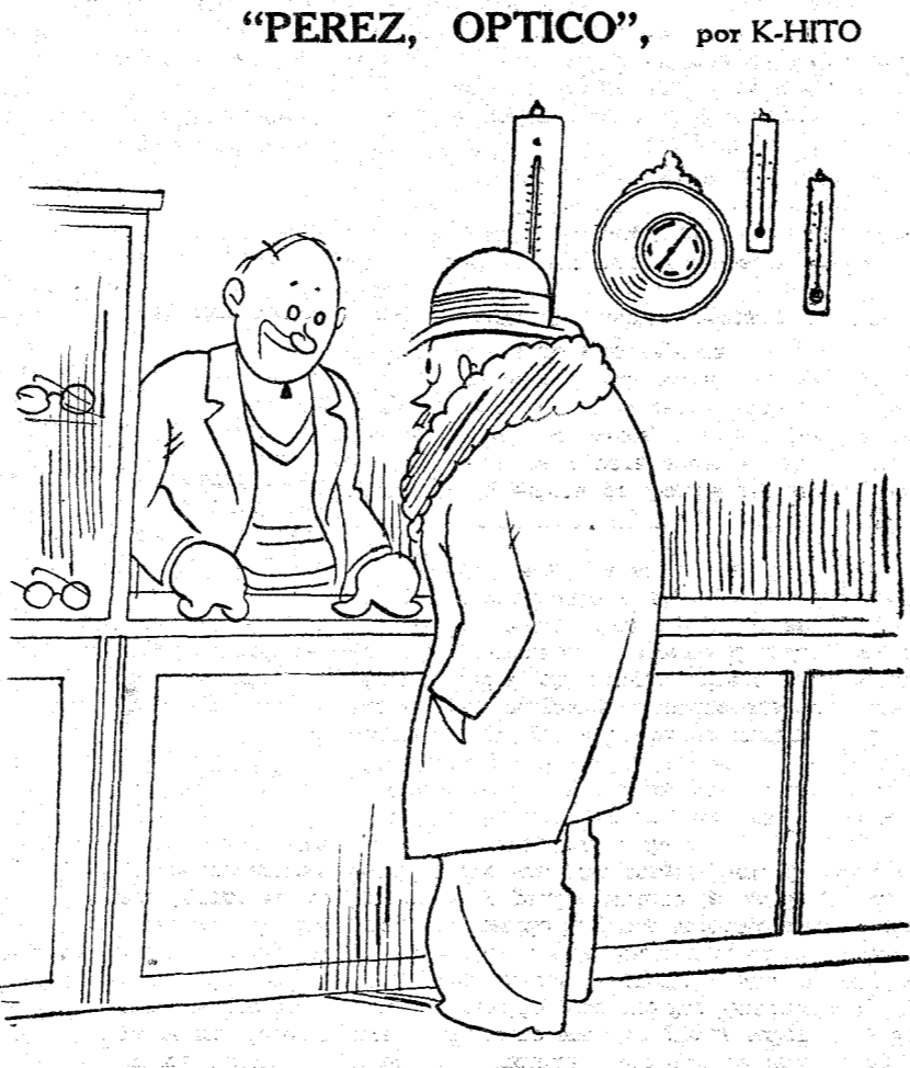
—Quiero una lupa. —¿De qué tamaño? —¡Pchs! Regular, regular. Es para ver la flamante minoría de izquierdas.