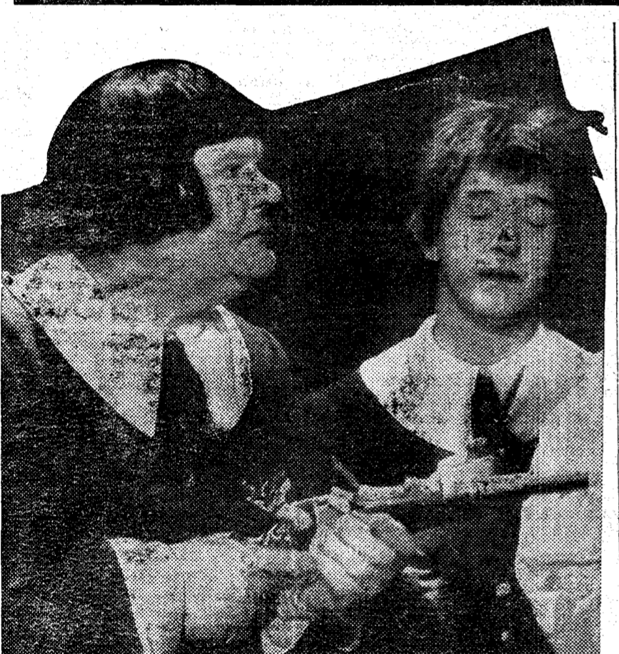
Stan Laurel y Oliver Hardy, los bufos de la pantalla, que el próximo lunes se presentarán en el Palacio de la Música en el graciosísimo "film" "Fra Diavolo"

Cosecheros: Registrad vuestras marcas en esta nación de 130.000.000 de habitantes donde se ha abolido la ley seca. AGENCIA OFICIAL SCHLEICHER Y SANCHO. MADRID, Cruz, 23. Fundada 1896. PATENTES, MARCAS, MODELOS, NOMBRES COMERCIALES, ROTULOS DE ESTABLECIMIENTOS