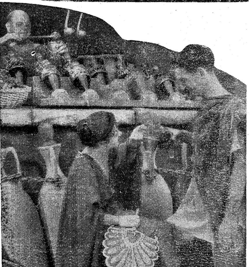
Un momento de "El signo de la Cruz", maravilloso "film" que se proyecta con extraordinario éxito en el Capitol