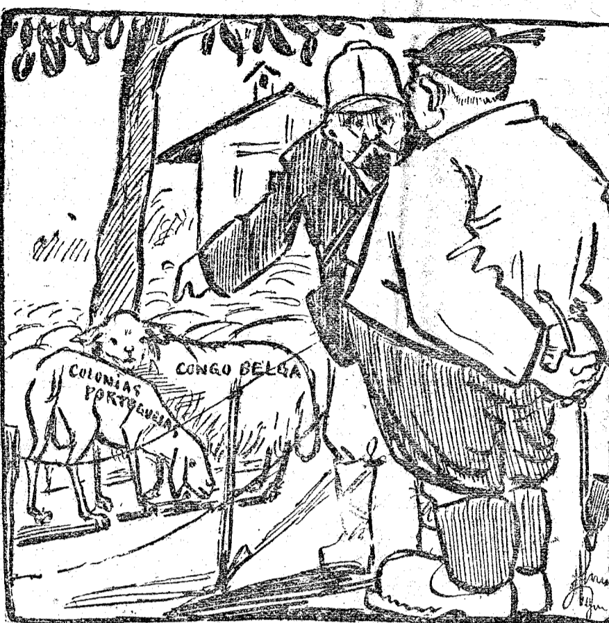
EL FRANCÉS.—Puede usted llevarse el que le guste. EL ALEMÁN.—Buen, bien; yo entraré en el redil y elegiré.