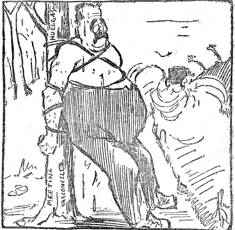
—Cielos! Cada vez más solo y más "amarrac".