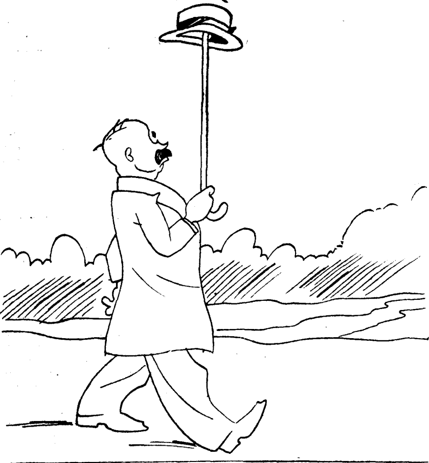
—Claro, señor. Dicen los revolucionarios que hay que apuntar más abajo del sombrero.