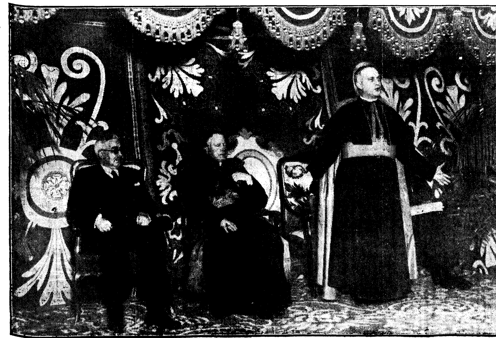
Una nota de la presidencia del acto