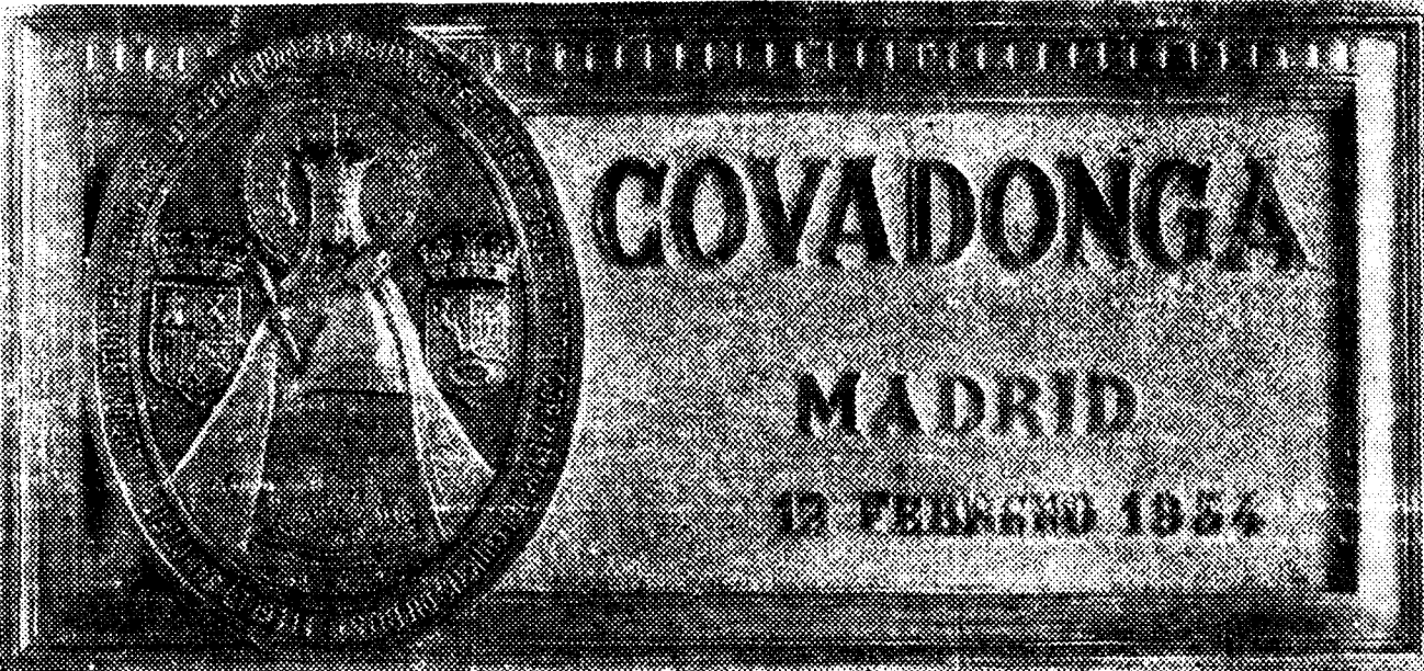
La placa de bronce con el nombre "Covadonga", y un relieve de la sagrada imagen, que se ha fijado en nuestra nueva rotativa. Es obra de subido mérito, ejecutada por don Félix Granda