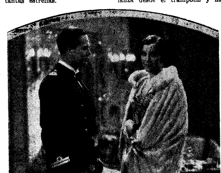
Cine Bellas Artes El programa de esta semana ofrece gran interés para las se-

firmado nuevamente como uno de los primeros galanes de todas las pantallas, actúa de galán de Lillian Harvey, formando una pareja pictórica de simpatía.