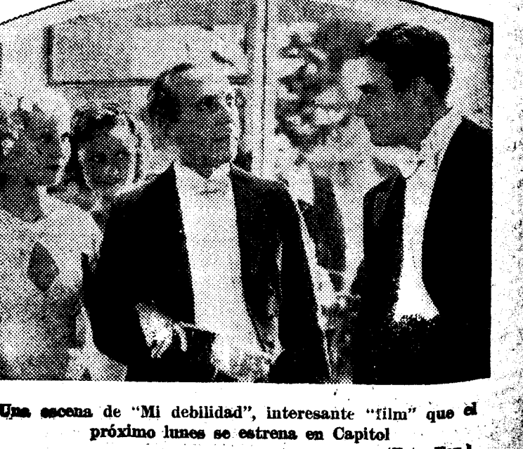
Una escena de "Mi debilidad", interesante "film" que el próximo lunes se estrena en Capitol