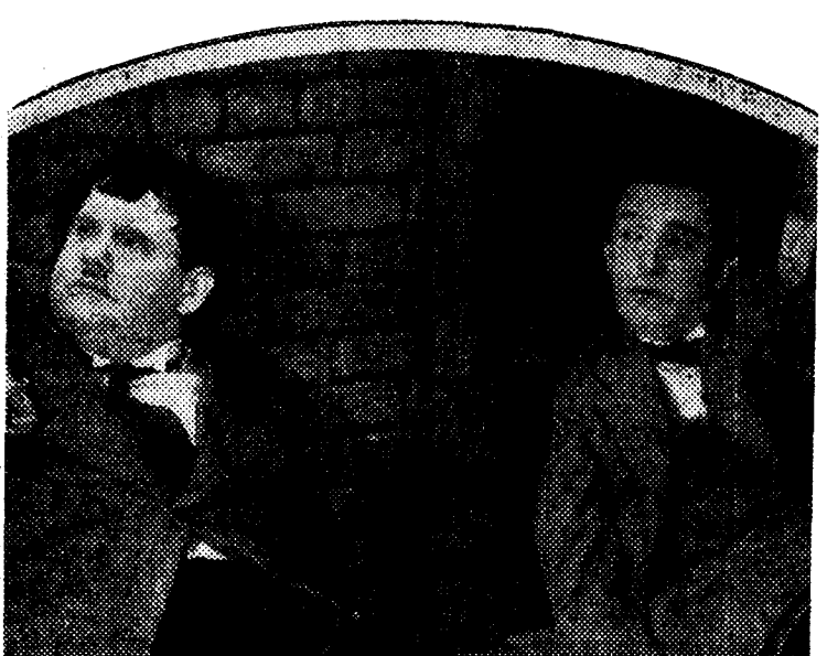
Stan Laurel y Oliver Hardy en la graciosísima película "El abuelo de la criatura", que próximamente se estrenará en Palacio de la Música