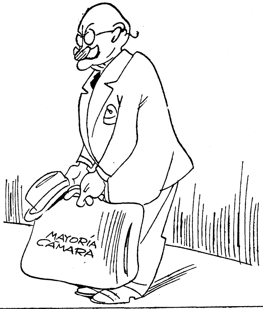
—¡Pesa esto mucho para que yo me aleje!