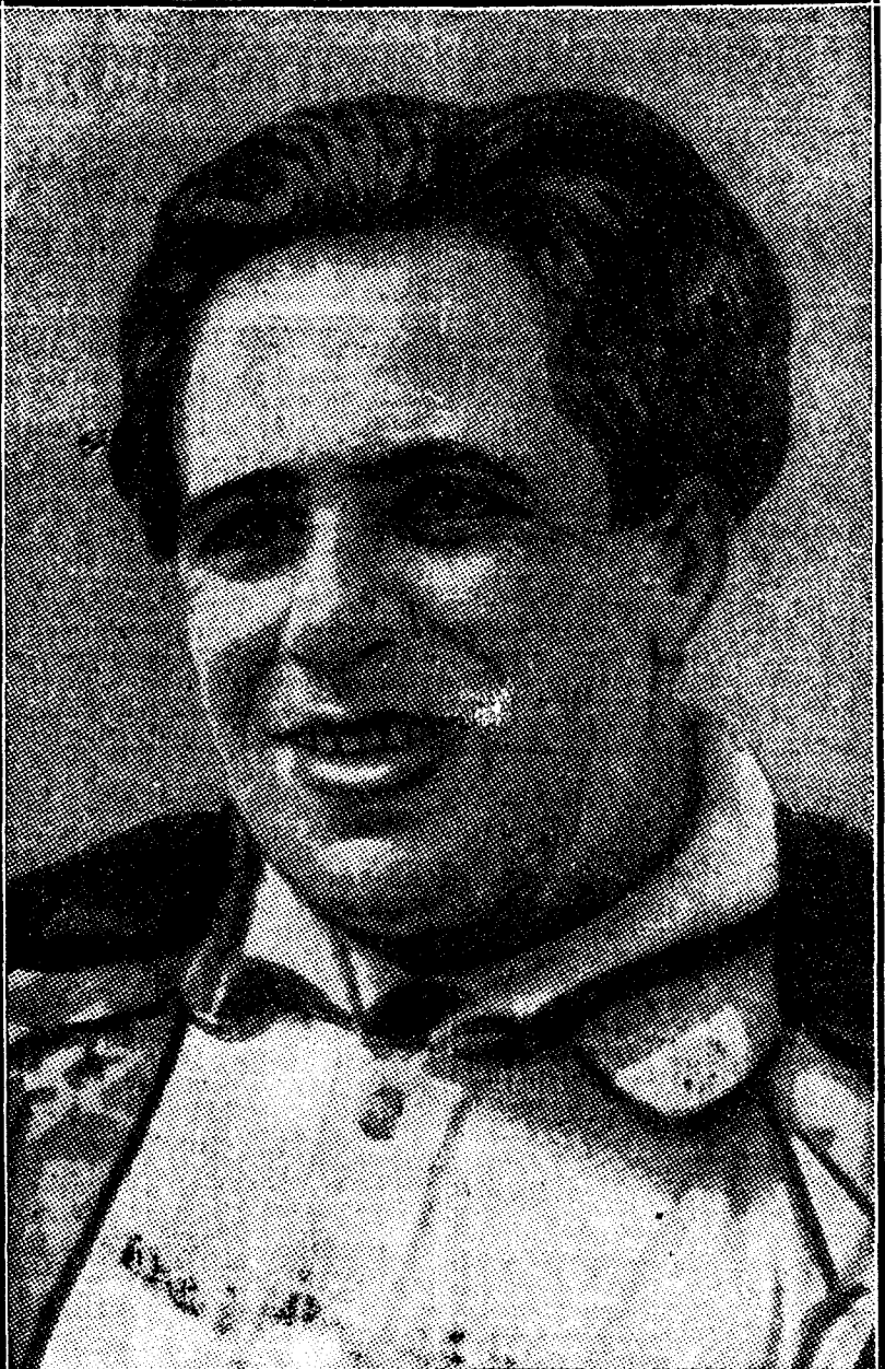
El aviador italiano Donati, que ha batido el "record" mundial de altura, consiguiendo elevarse a 14.435 metros