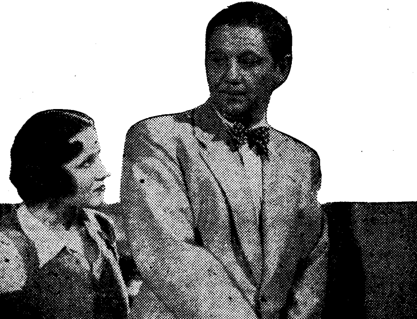
Franziska Gaal y Paul Hörbiger en la deliciosa película "Escándalo en Budapest"