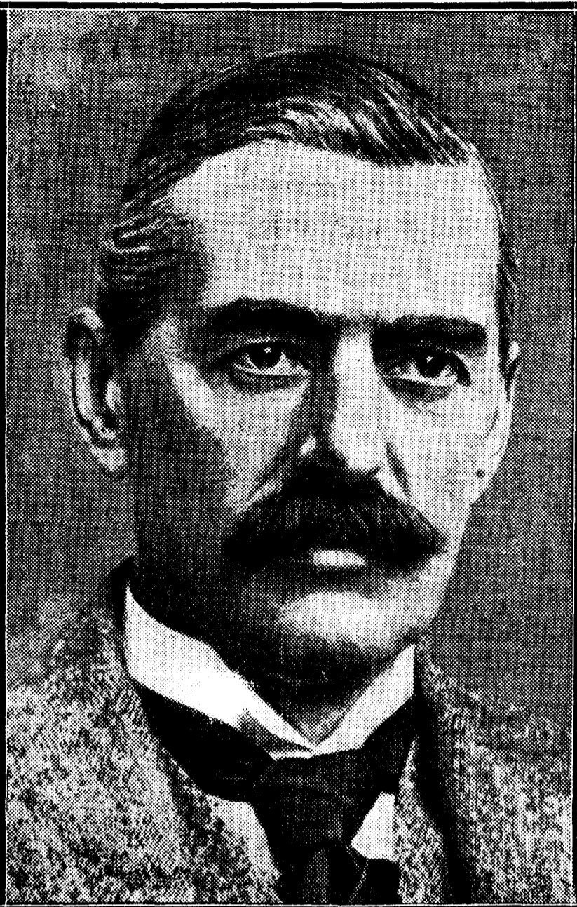
Neville Chamberlain, ministro de Hacienda británico, que ha presentado un presupuesto en el que se reducen los impuestos y se aumentan los salarios