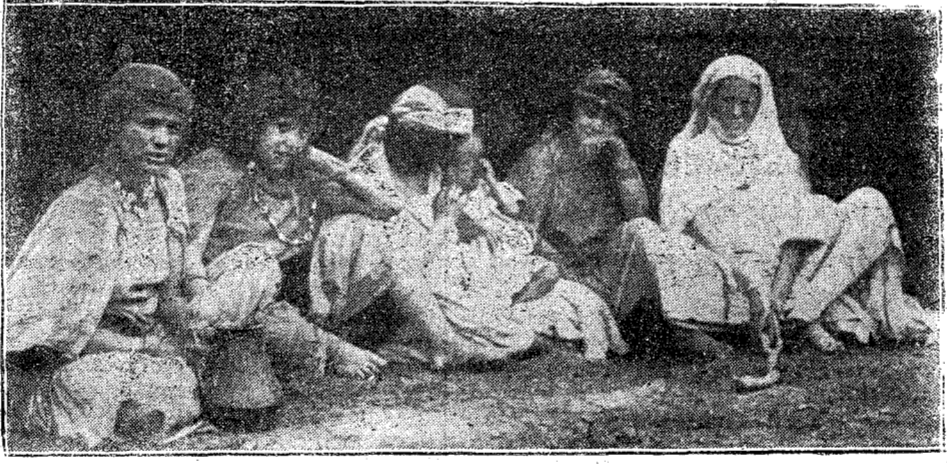
INDIGENAS DE BENI-PAKLAN