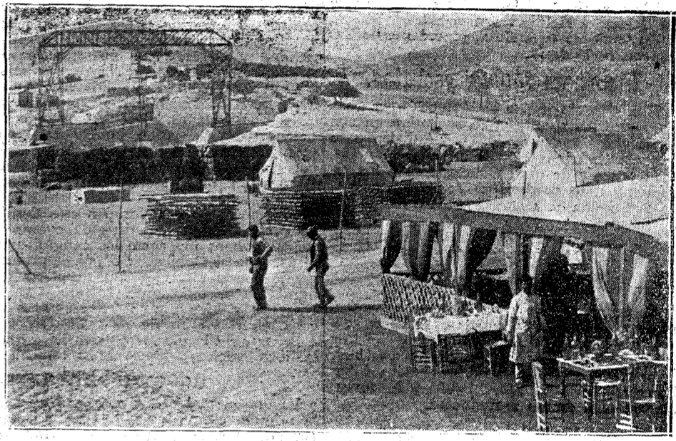
EL AVANZAMIENTO DE SAN JUAN DE LAS MINAS

El general Ros hace el número 118 en el escalafón de los de su clase. Entre otras condecoraciones, se halla en posesión de la gran cruz de la Orden militar de San Hermenegildo.