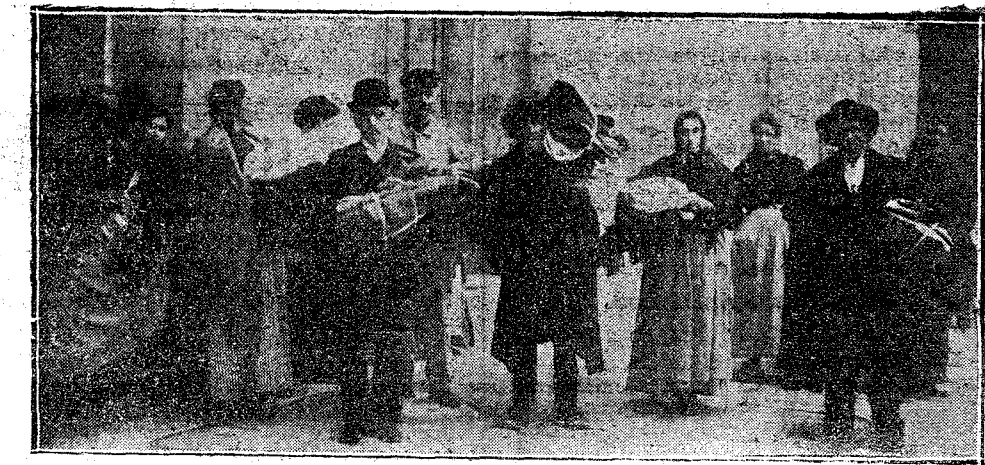
LOS POBRES SALIENDO DE PALACIO DESPUÉS DE RECIBIR LAS LIMOSNAS DEL ROPEÑO REINA VICTORIA