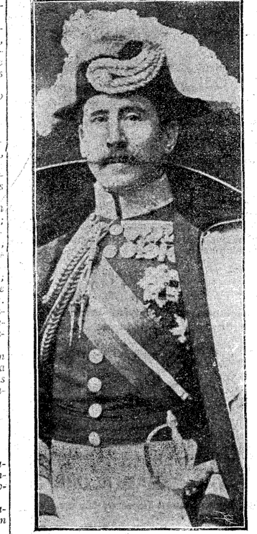
El conde del Serralles, capitán general de Valencia. De actualidad hoy con ocasión del suceso por los criminales de Cullera.

Léase el artículo sobre La campaña viaticando el honor patrio y la actitud del "trust", que aparecerá mañana en nuestras columnas.