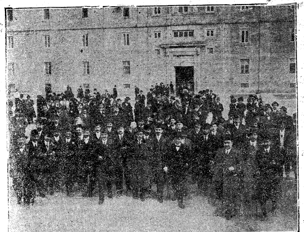
CONGRESO ODONTOLÓGICO.—Los congresistas en el Monasterio de El Escorial.