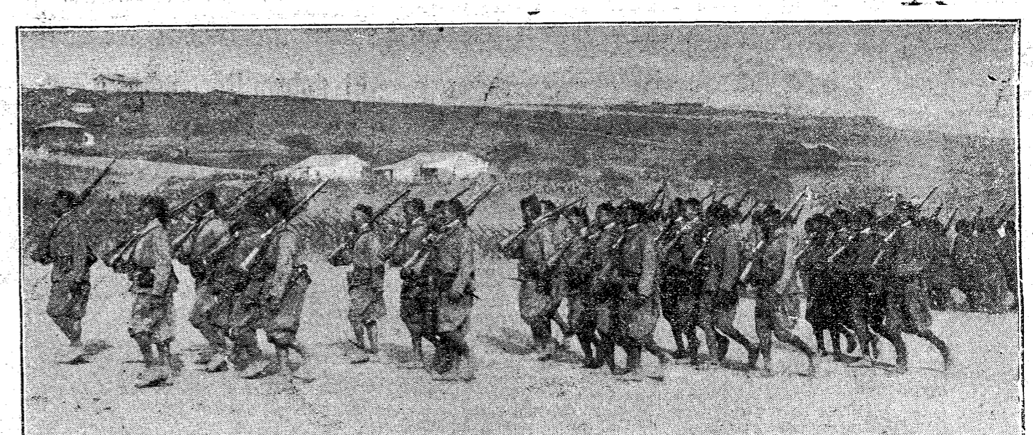
CEBUTA.—Tabor de la policía indígena.

Añadió que no debía ni siquiera haberse suscitado tal cuestión en la Cámara.