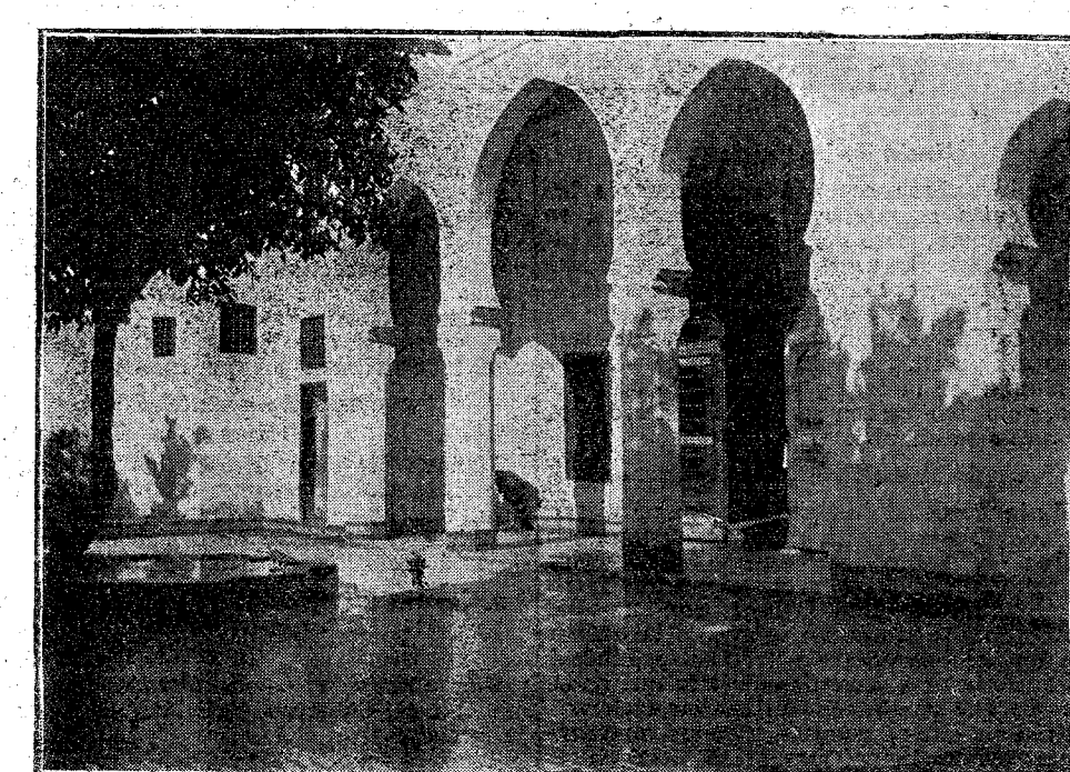
PATIO DEL CONSULADO FRANCÉS EN FEZ

—¡Qué escándalo!—decían.—¡Muchos miles de duros para la Prensa católica, mientras hay gente que se muere de hambre en plena calle! ¡Y á eso se le llama ser caritativo! ¡Vaya una caridad!