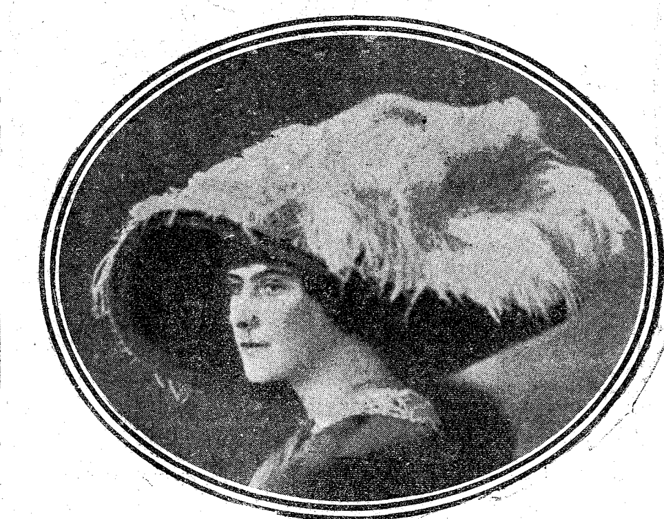
EXPLICACIÓN DEL FIGURÍN

Se trata de un sombrero modelo de la casa Lucienne, de París. Es de terciopelo violeta, adornado con ríes plumas de avestruz. Para que nuestras amabilísimas lectoras puedan orientarse en este capítulo femenino de los sombreros, tan interesante para todas, publicaremos distintas formas y diferentes modelos «á la última».