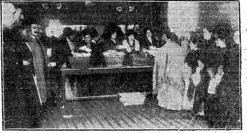
COMIDA A LOS POBRES, PAGADA POR LA INFANTA MARÍA TERESA EN EL DISTRITO DE LA LATINA.

Los albañiles y los peones de la Provenza protestan contra la invasión italiana; los Sindicatos de obreros agrícolas de Seine-et-