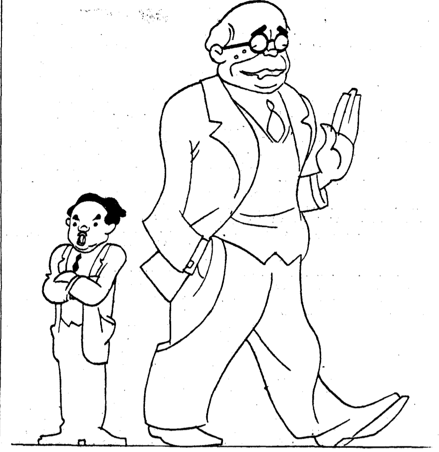
"Agua que no has de beber, déjala correr".