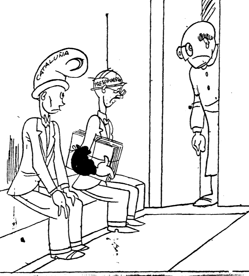
—¿Quién es el primero?