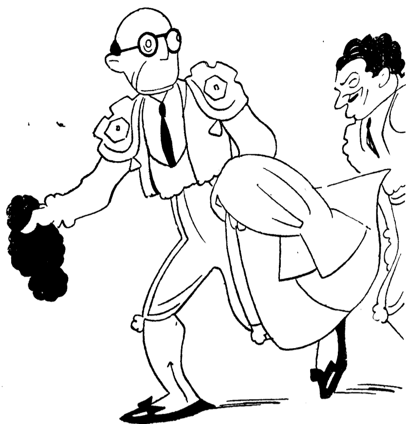
Y el Gobierno cosechando... palmas.