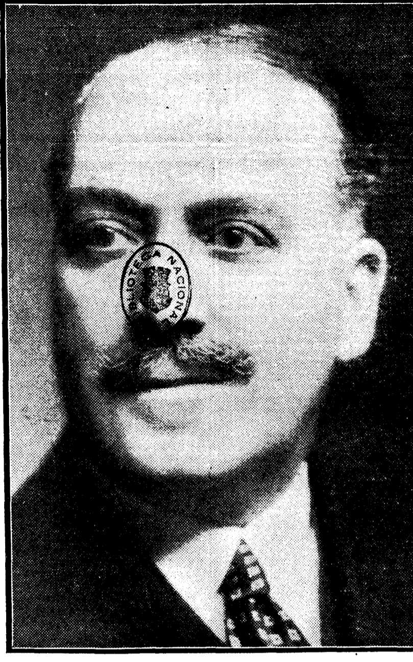
Don Pedro Pan Gómez, subgobernador primero del Banco de España, a quien el Gobierno acaba de conceder la Gran Cruz de Isabel la Católica.