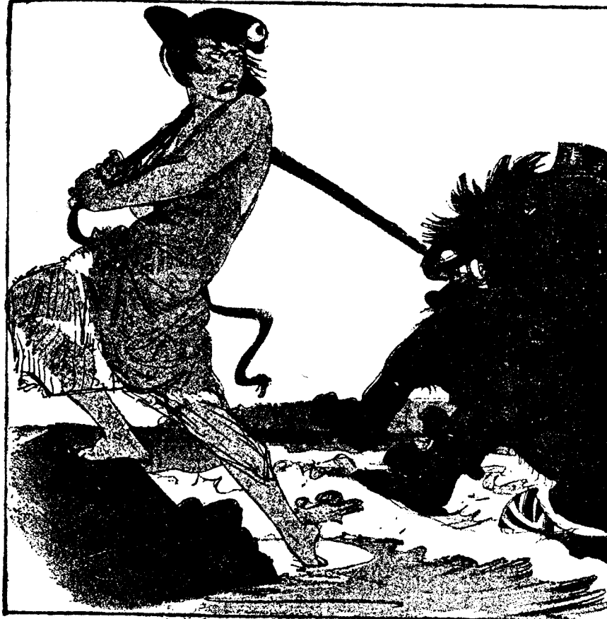
EL LEON BRITANICO: ¿COGIDO OTRA VEZ? ("Kladderadatsch", Berlín.)