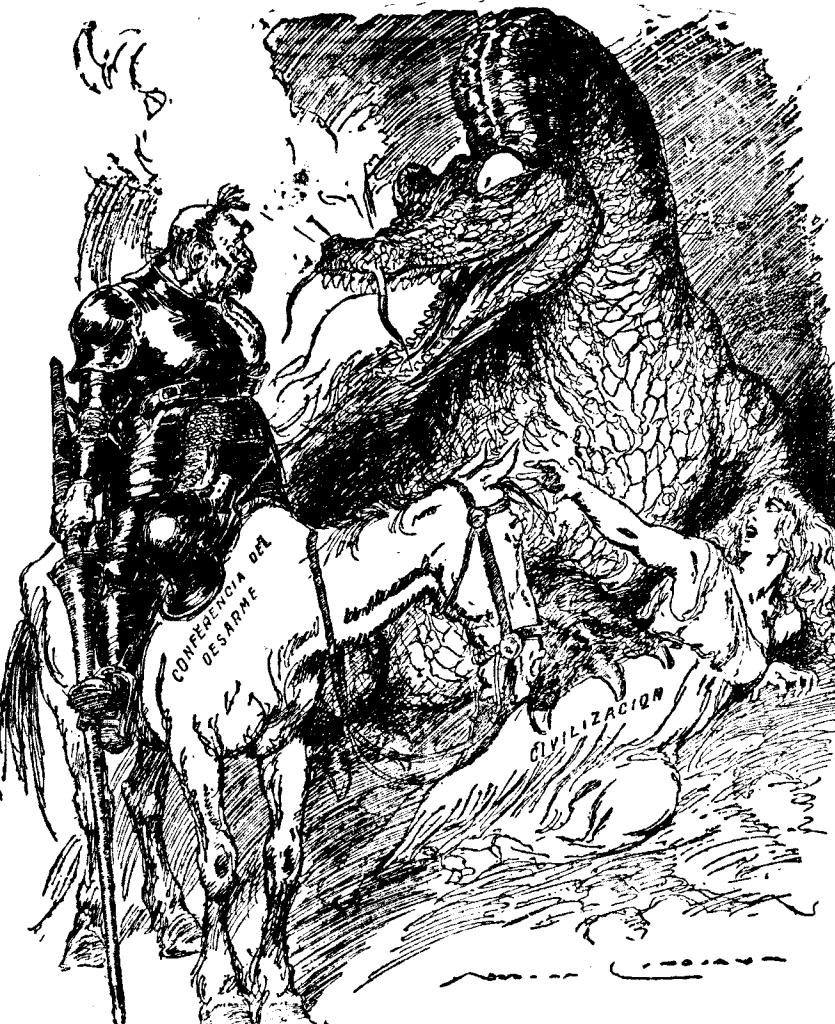
"Vamos a reservar nuestra decisión otro año todavía." ("Sidney Bulletin")