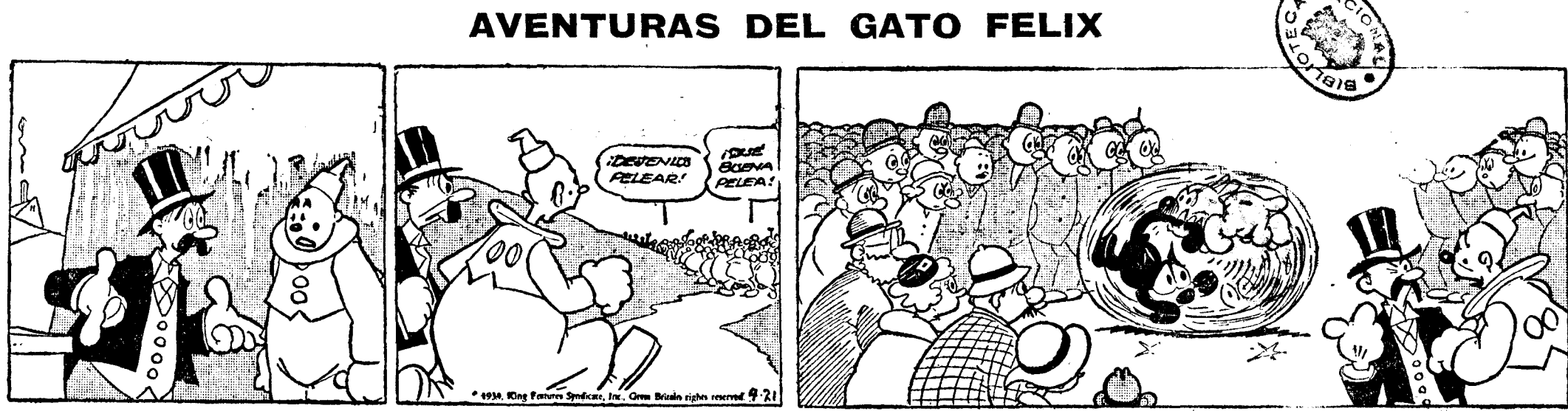
—Como sigamos así, vas a tener que comer hierba, porque aquí no viene ni una mosca. —Pero qué griterío es ese? Claro, toda esa gente ahí y nosotros con la boca al sol. —Con esta lucha no quieren saber nada del circo. O los separas o no comemos.

COMPRAS bien trajes caballero, muebles, colchones, ropas, porcelanas, bronce, saldos, objetos. Lafuente, Teléfono 77029. (7) ALHAJAS , papeletas del Monte. Para más que nada. Granda, Espoz y Mina, 3, 2, entresuelo. (7) ALHAJAS , papeletas Monte. Casa Popular de mucho dinero. Espartaco, 6. (V) DINERO rápido por automóviles. Teléfono 13263. (A) PAGO oro ley 8,70 gramo y fino 7,90. Venta de alhajas ocasión verdad. Dolidán. Preciados, 34, entresuelo. Teléfono 17333. (2)