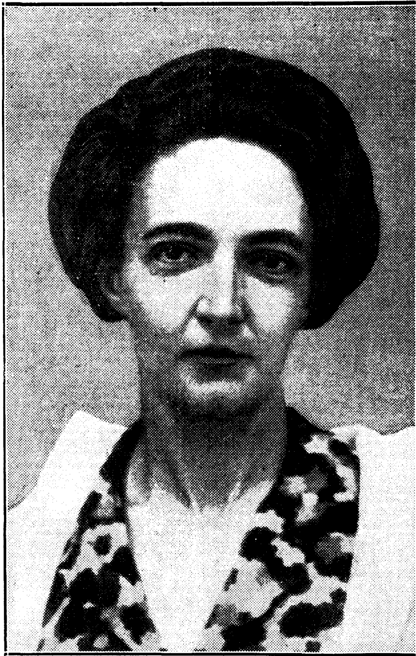
Mme. Joliot-Curie, descubridora de un nuevo producto sustitutivo del radio