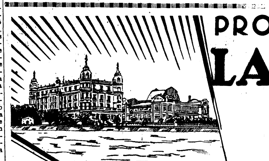
JABON DE TOCADOR • JABON • Y CREMA DE AFEITAR • PASTA DENTRIFICA • POMADAS • CREMAS • COLONIAS • AGUAS • SALES • LODOS

En la decadencia de la polifonía, es decir, hacia 1600, la melodía recobra su independencia. Es el comienzo de la ópera y también el de la música popular. Los investigadores del folklore tienen que empezar sus trabajos de desbroce en esta época si el resultado ha de tener unidad y ha de seguir una línea directriz.