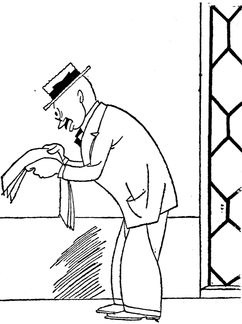
"Notas financieras.—Siguen inactivos los Explosivos".