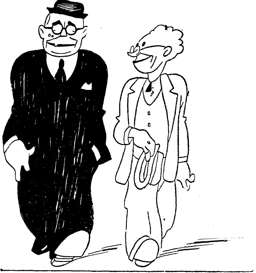
—¿Y qué, don Manuel? ¿Volverá usted por allí con motivo de algún acta, digo, de algún acto?