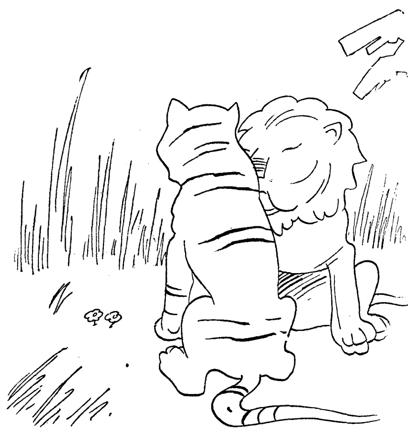
—¿Y la pantera? —Se ha puesto mala leyendo los relatos de lo ocurrido en Asturias.