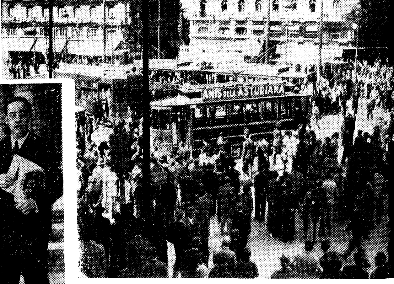
En la Puerta del Sol, el tráfico es también normal. Bien lo demuestra esta vista parcial de la típica plaza, con los habituales medios de transporte