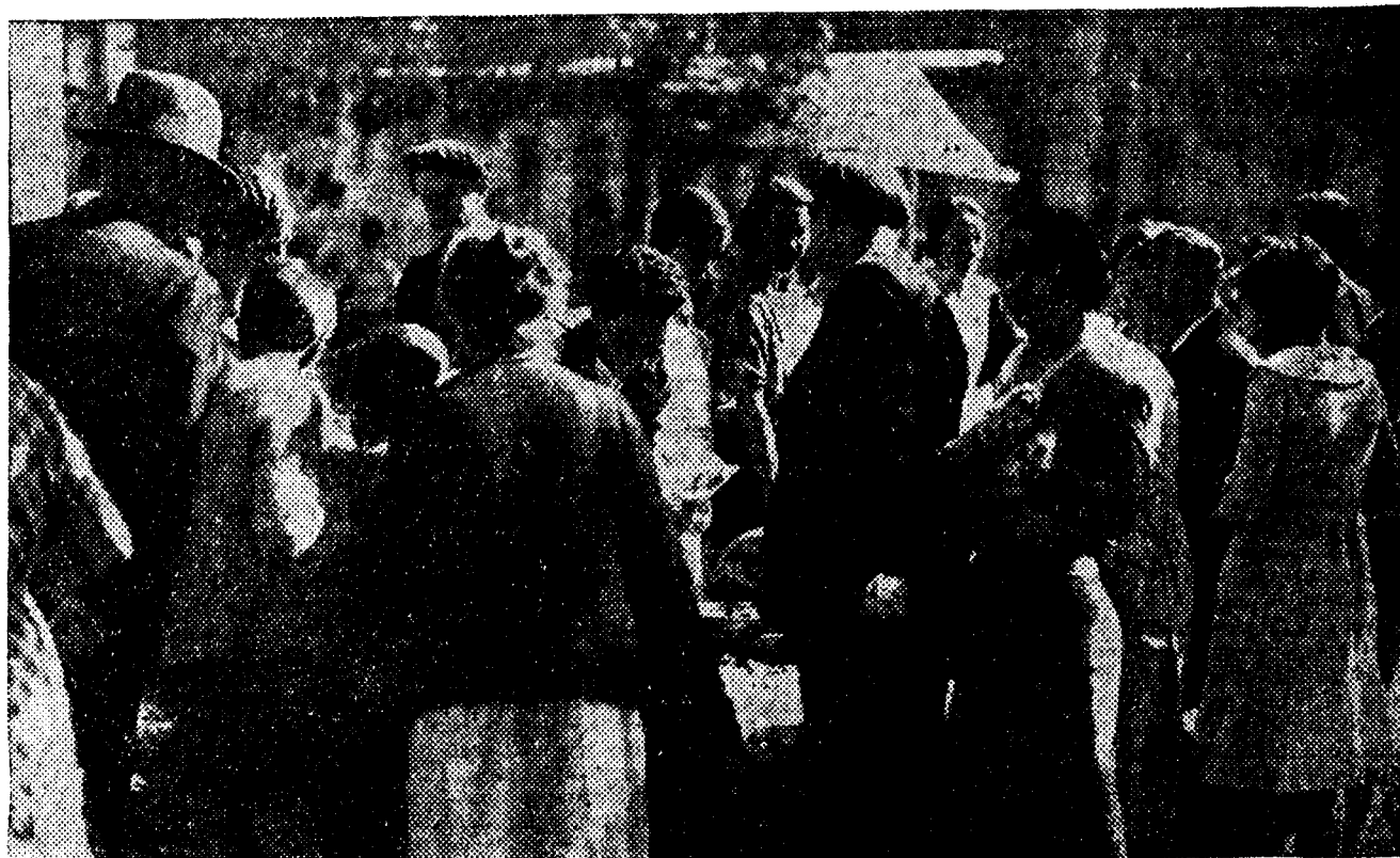
En Correos hubo un intento de huelga, que fracasó rotundamente. Los carteros, reintegrados a su función, repartieron ayer la correspondencia