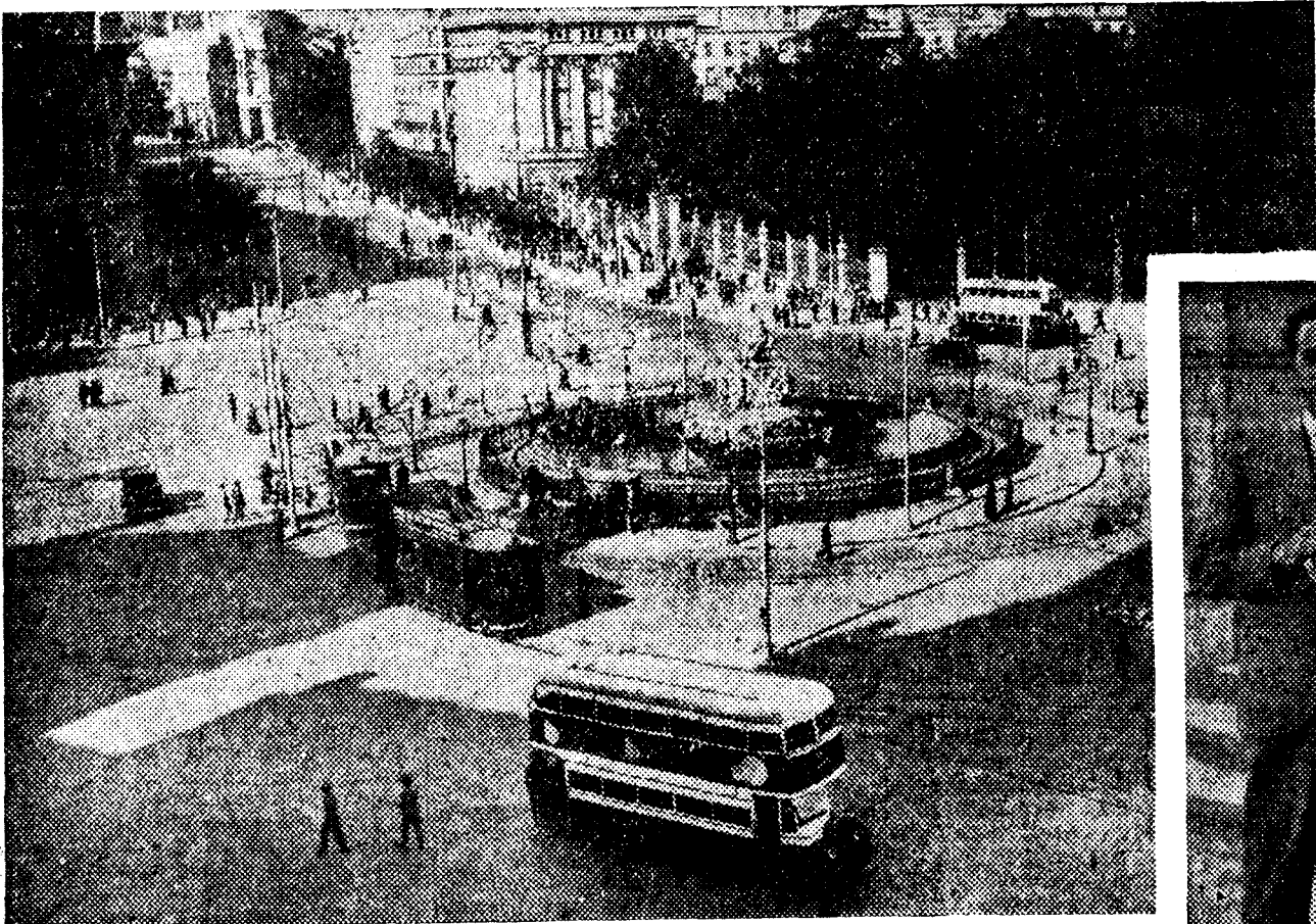
Un aspecto de la Obispos. Los tranvías, los autobuses y los "taxis" circulan normalmente al servicio del público que los ocupa... como todos los días