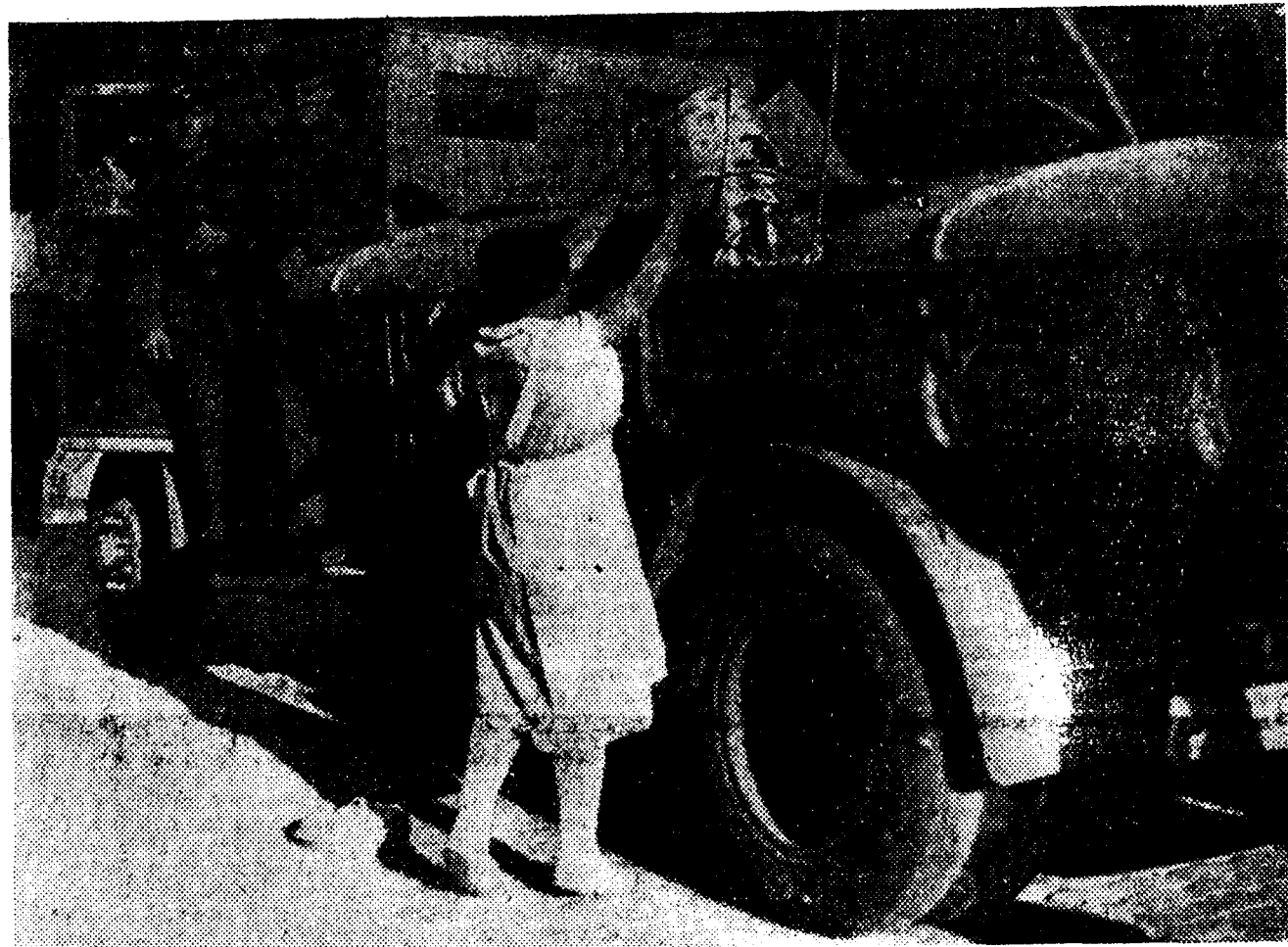
Ha funcionado como de ordinario el Servicio de Limpiezas. Como de ordinario, en cuanto a la eficacia; por excepción en cuanto a los conductores, soldados entusiastas del cumplimiento del deber