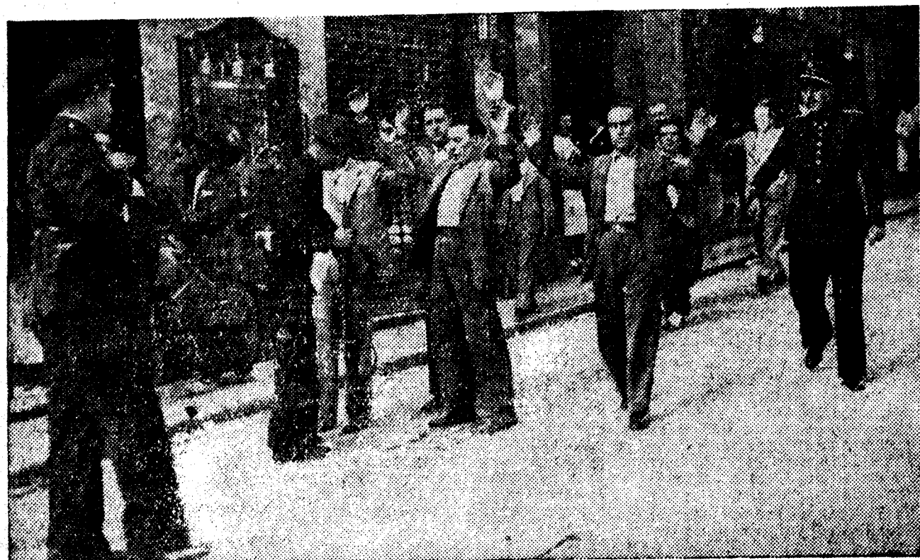
Abajo: La autoridad, representada por la fuerza de Asalto o por soldados, vigila el orden en las calles y garantiza el libre acceso al Metropolitano