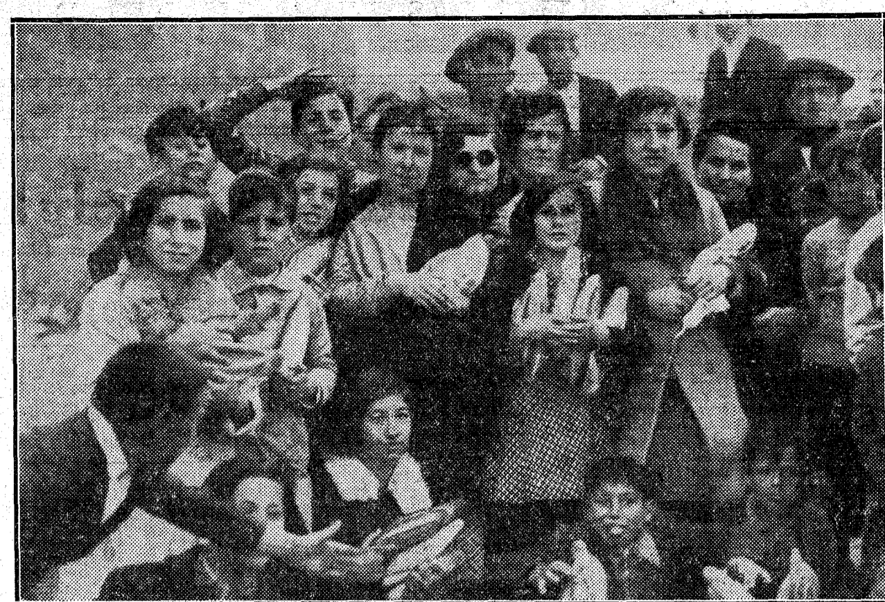
EL FRACASO DE LA HUELGA EN MADRID.—Un poco de espera en la "cola", y después pan en abundancia

no pudo hacer otra cosa que certificar la defunción del herido, que hasta ahora no ha sido identificado. También hay otras dos personas heridas, una de ellas grave, en este tiroteo, cuyas filiaciones se ignoran.