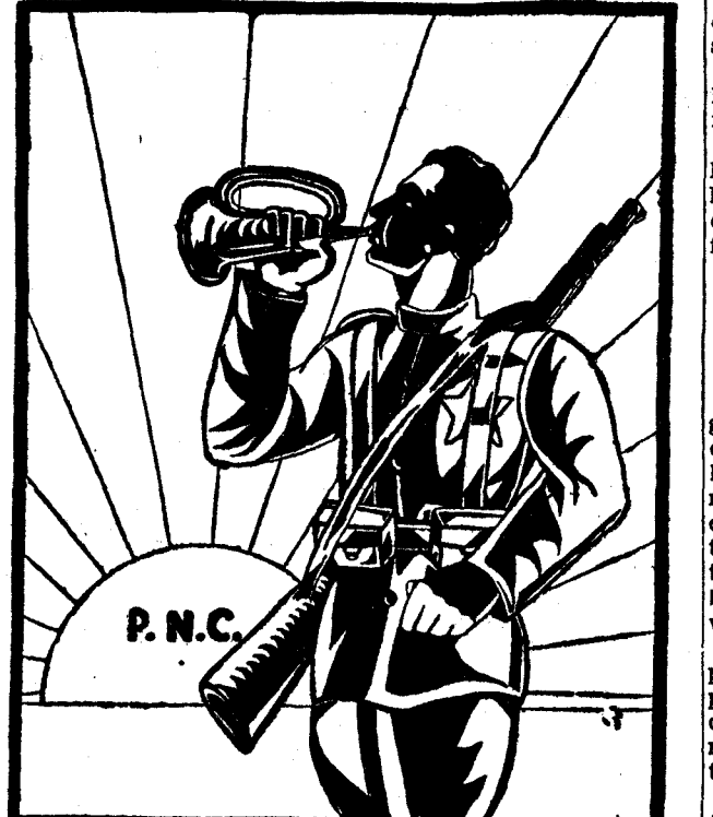
A LES ARMES!!!