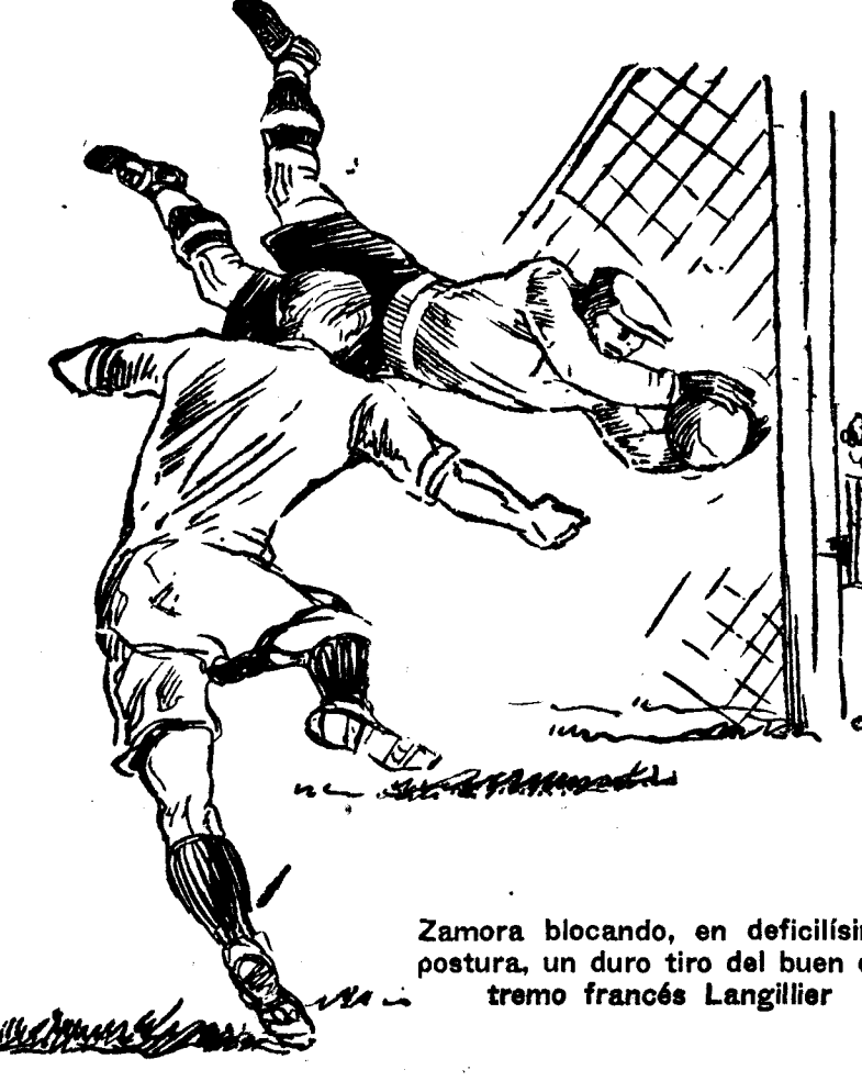
Zamora bloqueado, en deficitísima postura, un duro tiro del buen extremo francés Langillier