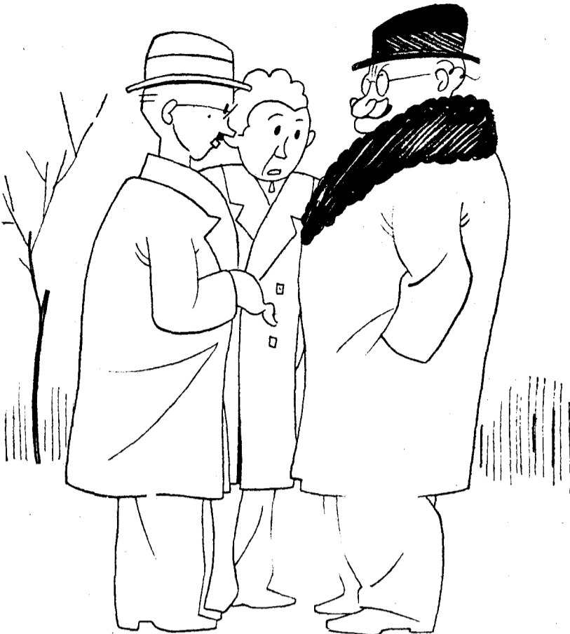
—¿Volverán ustedes a reunirse? —Sí; para las elecciones.