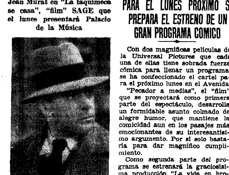
Jean Murat en "La taquimeca se casa", "film" SAGE que el lunes presentará Palacio de la Música