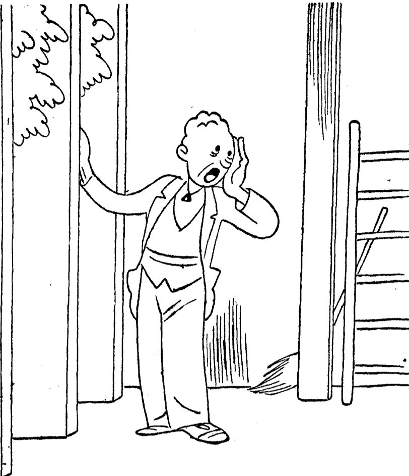
—¡Vamos, que hay que preparar el salón!