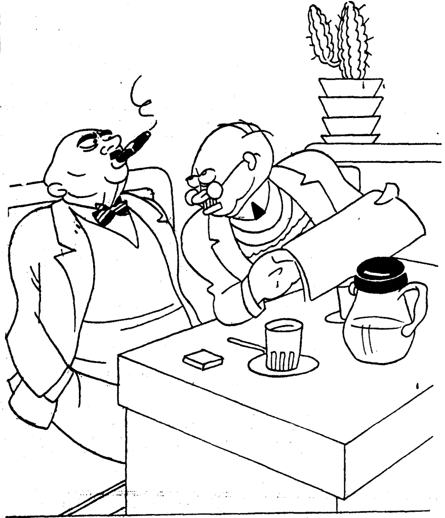
—Lo que parece ya un hecho es la telerrevisión constitucional.