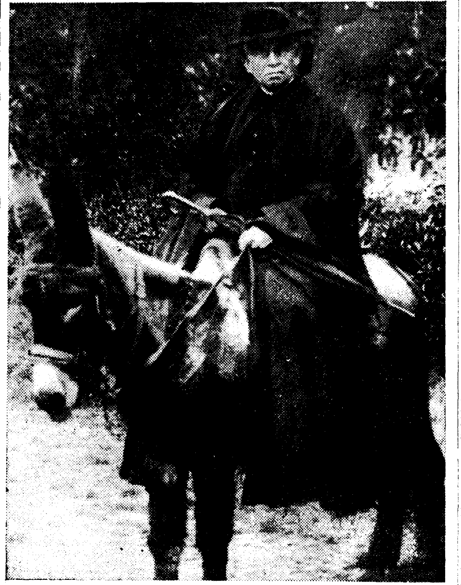
Don Andrés Manjón, el santo fundador de las Escuelas del Ave María, montado en "la Morena", la popular borriquilla sacromontana que acaba de morir