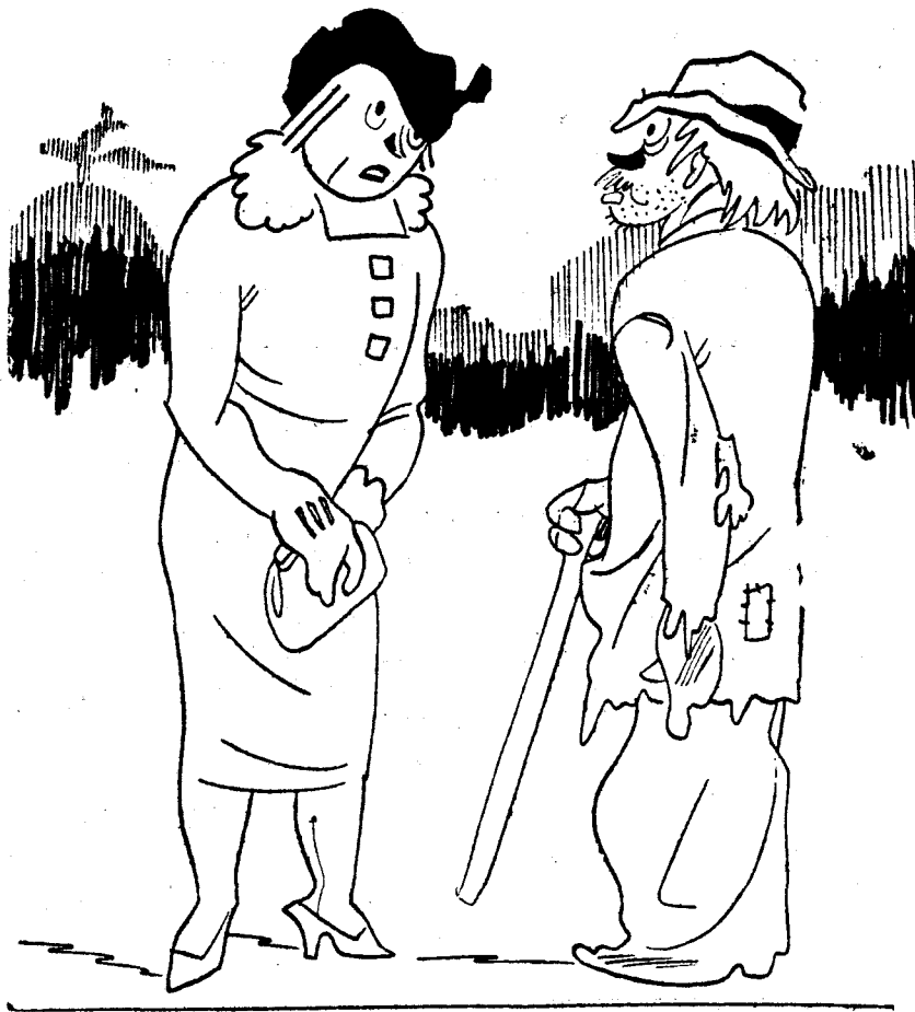
—¿No sabe usted que está prohibido pedir limosna? —Bien; pues présteme usted diez céntimos hasta el día primero.