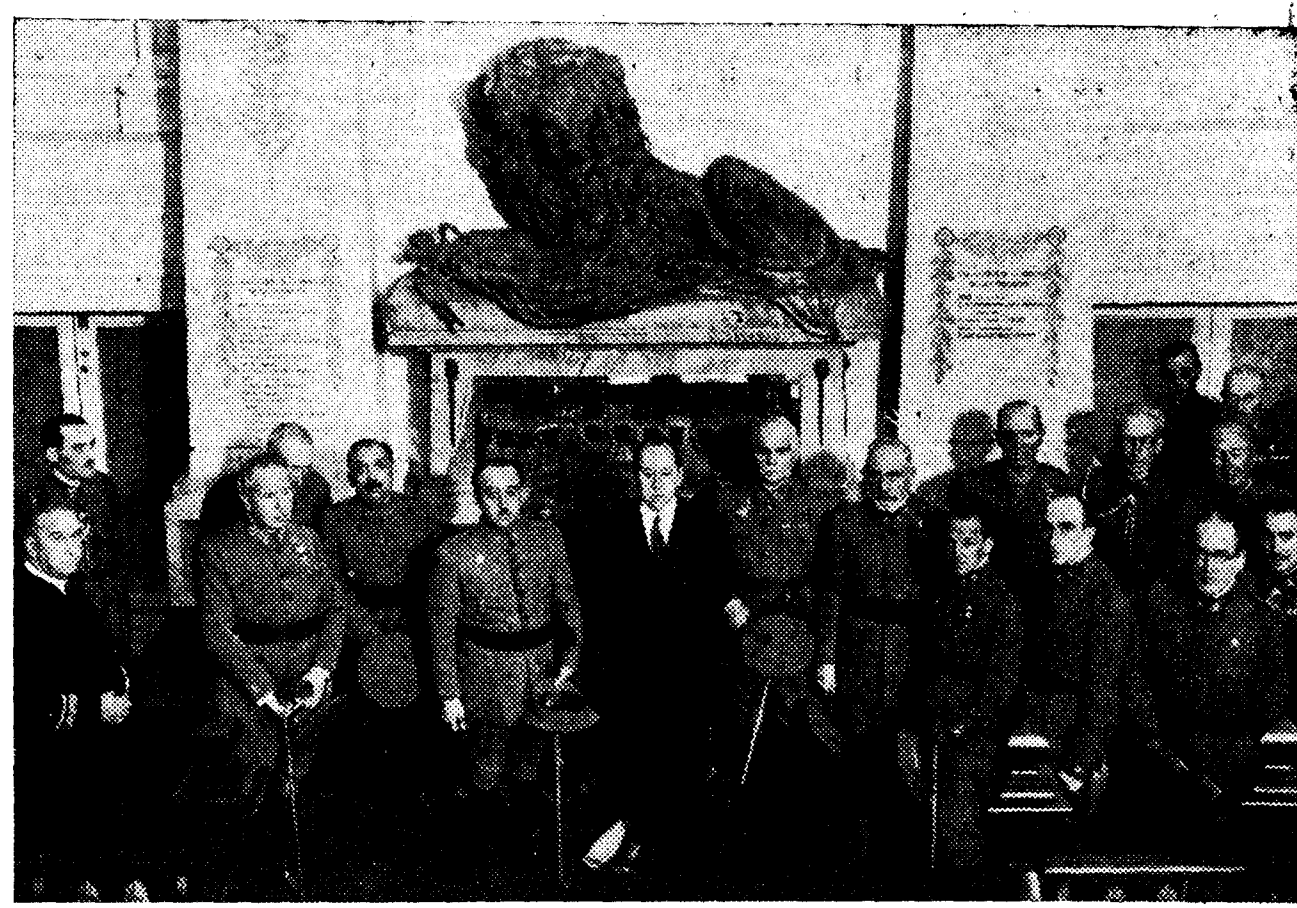
En la Escuela Superior de Guerra se celebró ayer, con asistencia del ministro de la Guerra, la entrega de diplomas e imposición de fajines a los nuevos capitanes de Estado Mayor. He aquí al señor Gil Robles rodeado de los generales que asistieron al acto