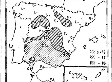
La ola de calor que el domingo estaba replegada en Sevilla se ha extendido en dos días a media España, incluso a Castilla la Vieja.

BELEM DE PARA, 18.—El nuevo avión para el aviador español Pombo ha llegado, procedente de Inglaterra, a bordo del vapor "Dunstan". El mecánico que ayudará a montarlo se espera que llegue mañana a bordo del vapor "Hilary". Pombo continúa con el proyecto de reanudar el vuelo hacia Méjico el día 25 del corriente.—United Press.