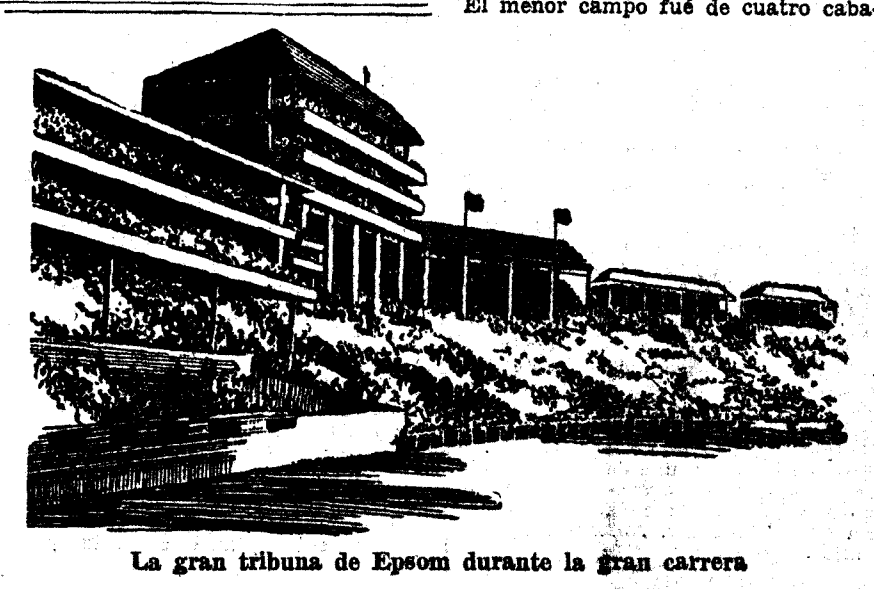
La gran tribuna de Epsom durante la gran carrera