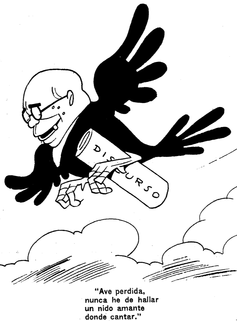
“Ave perdida, nunca he de hallar un nido amante donde cantar.”