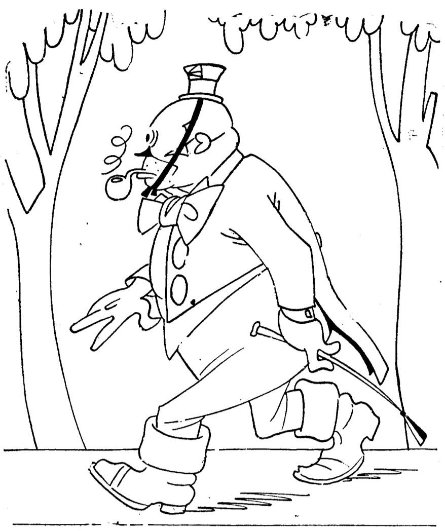
Un número que no estaba en el programa