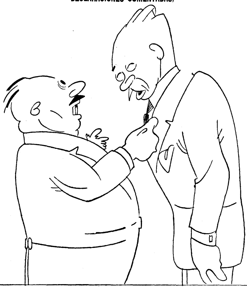
—¿Y dice usted que es doctor en Derecho. —Sí; del pataleo.