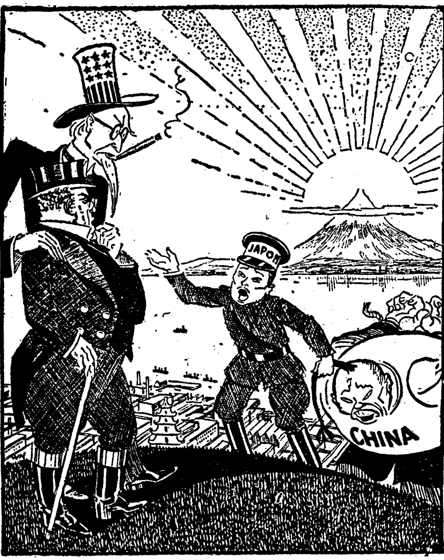
En política japonesa esto se llama "cooperar" ("Glasgow Bulletin")