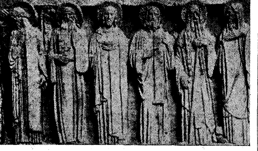
Henri Bouchard: Seis Apóstoles, esculturas en piedra para la nueva Iglesia de San Pedro de Chaillet, en París

ma cristiano, desentendiéndose totalmente al Arte de la circundante realidad social. Y una imaginaria de acarreo, imitación, vacía de fórmulas tradicionales, servida por artistas mediocres en obras industrializadas, se impone, definiendo una etapa de extrema pobreza en la historia del arte católico.