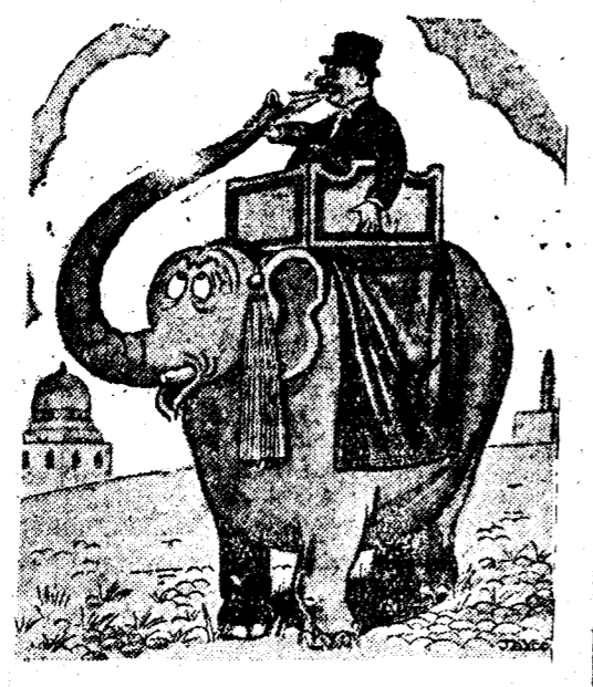
EL TUBO ACUSTICO —A casa, Manolo.