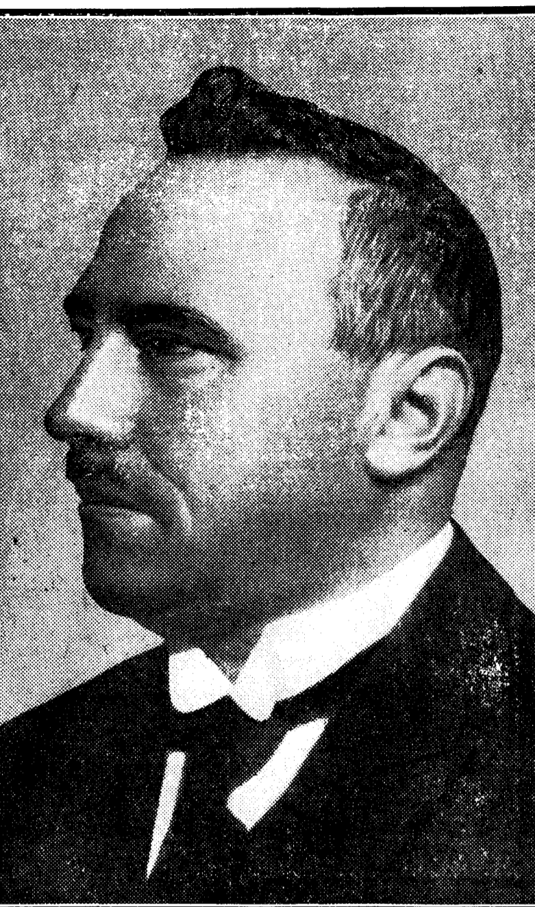
Rodolfo Minger, nuevo Presidente de la República suiza

El nuevo jefe del Estado suizo es un agricultor que dirige la explotación de su finca. Casi podría decirse que cultiva él mismo la tierra. Como estudios, sólo el certificado de la escuela primaria; lo demás, inteligencia y carácter. Ha hecho una rapidísima carrera. En 1919 era un desconocido que se lanzaba a crear un partido nuevo de "burgueses, labradores y artesanos" en su cantón de Berna. Ocho años después es presidente de la Cámara, y, al cabo de dos años, llega a consejero federal, el primer paso para la Presidencia de la República; el segundo es la vicepresidencia del Consejo, que Minger ha desempeñado durante el año actual.