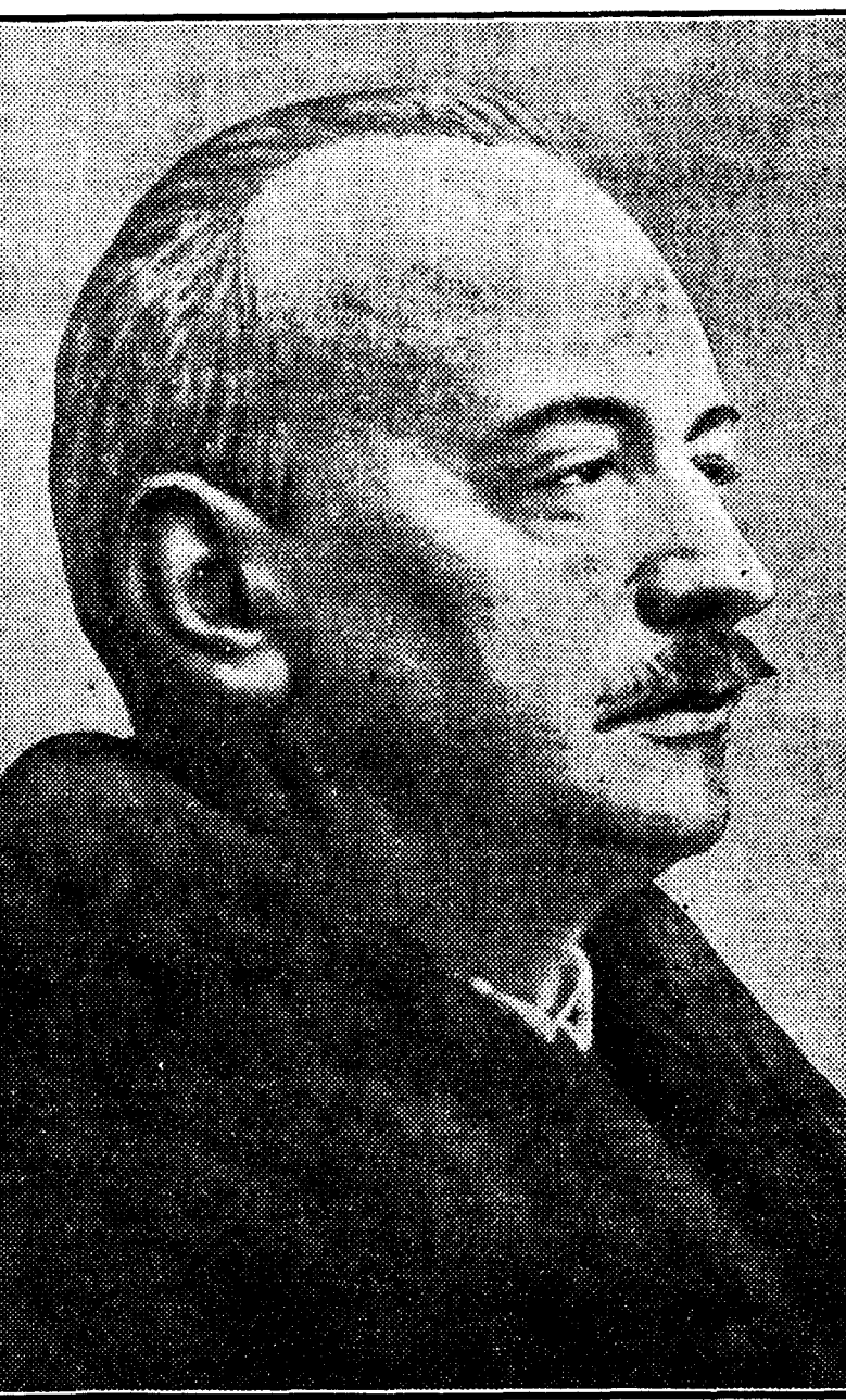
El señor Lotian Eger, nuevo ministro plenipotenciario de Austria en Madrid, que ha presentado sus cartas credenciales al Presidente de la República