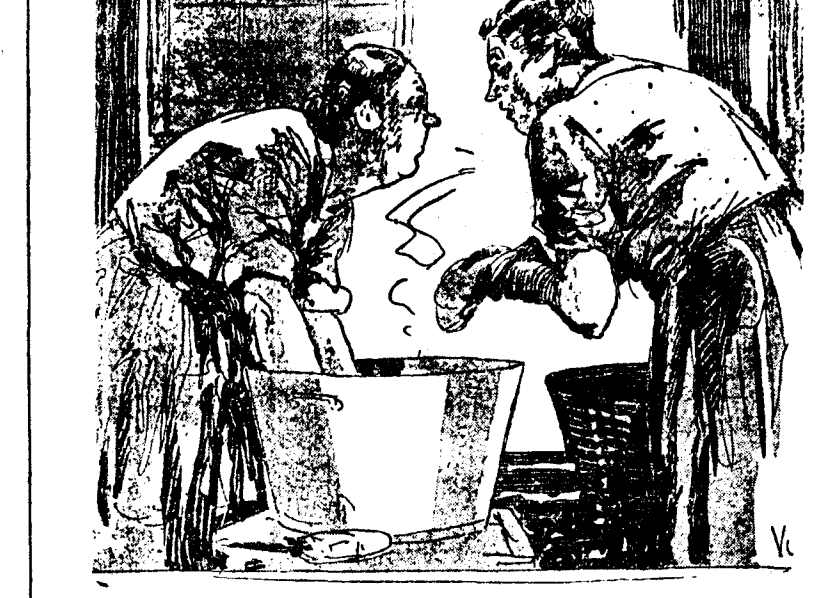
— ¿Y por qué tuvo que dejar su marido la colocación en la fábrica de cerveza? — El pobre se cayó tres veces al depósito. ("Aussie", Sydney.)