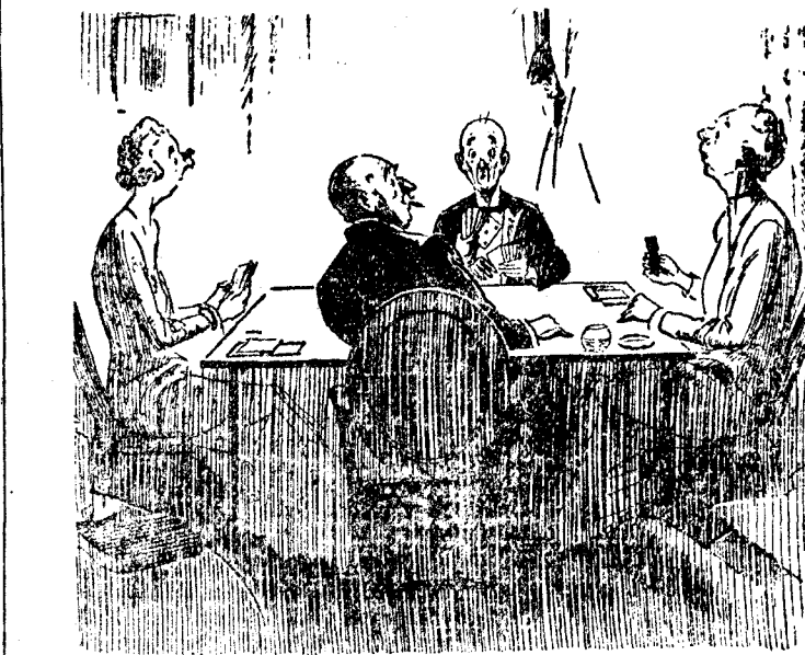
EL LADRON (que está oculto tras las cortinas y no se puede contener).— Pero juegue usted el ca, idiota!

¿Por qué llora bebe? TIENE ESCOCEDURA en la garganta. BALSAMO Y CALLARA BEBE