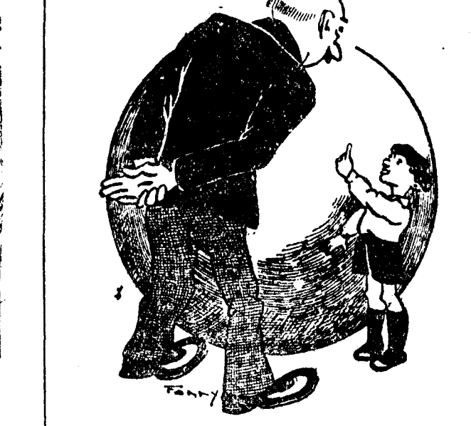
— ¿Qué ventajas tenían los romanos sobre nosotros? — No tenían que aprender latín. ("Moustique", Charleroi.)