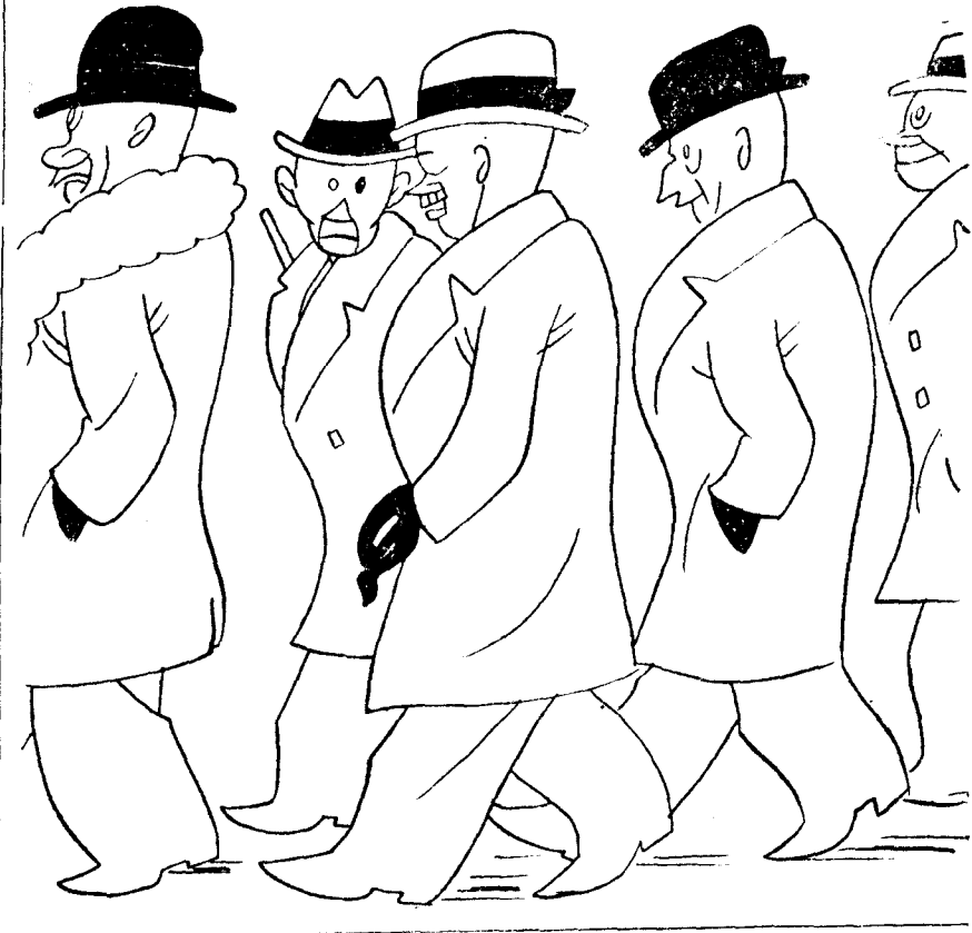
—Ya ves; la pobre Segunda con entiero de tercera. —Por lo visto ha sido una imposición de la primera.