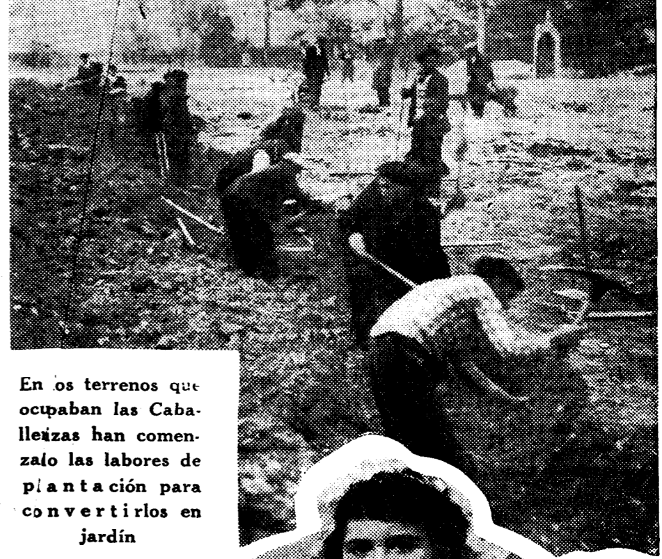
En los terrenos que ocupaban las Cabañizas han comenzado las labores de plantación para convertirlos en jardín