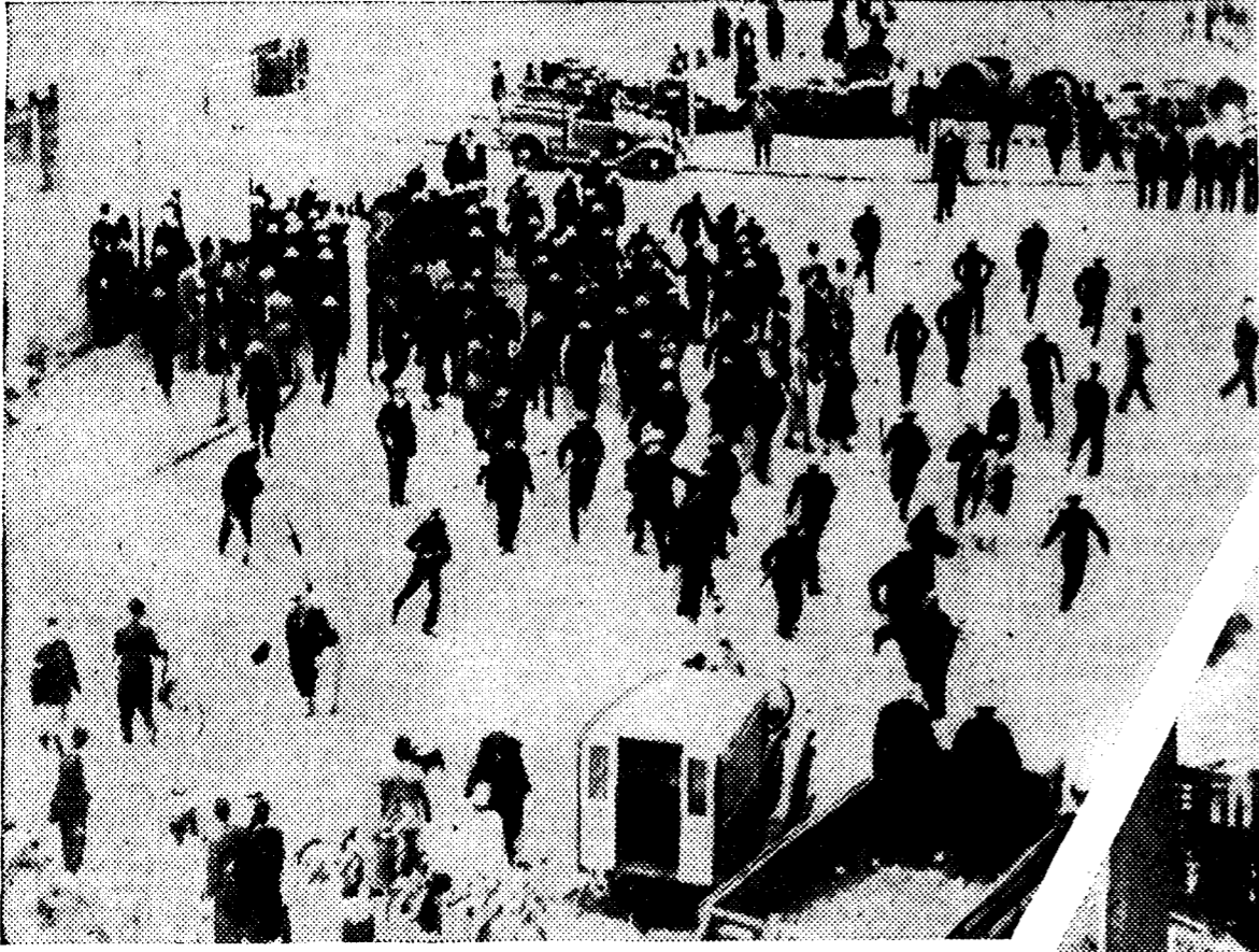
Una carga de la Policía durante uno de los recientes disturbios de El Cairo. A la derecha: los restos de varios tranvías que fueron incendiados por los revoltosos