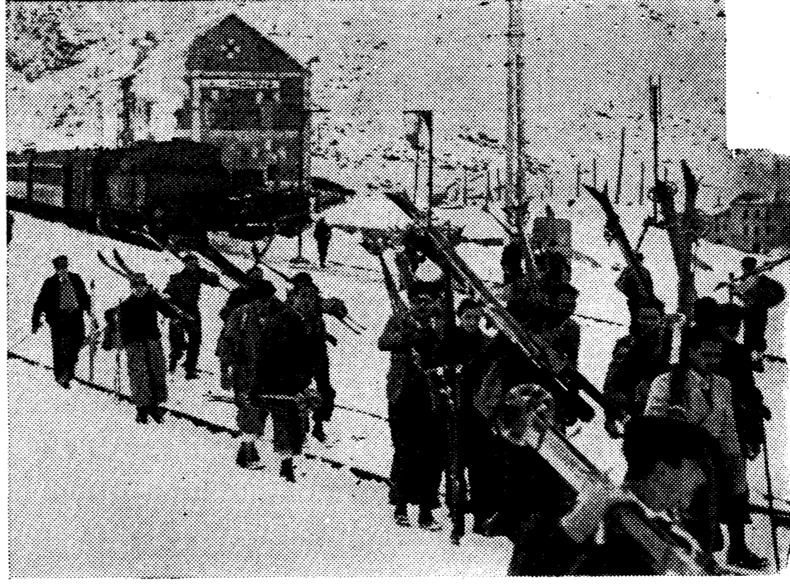
Las grandes nevadas han llevado numerosos deportistas a las cumbres del Pirineo catalán. He ahí la llegada de excursionistas a la estación de La Molina, y dos esquiadores dispuestos para tomar parte en una de las pruebas