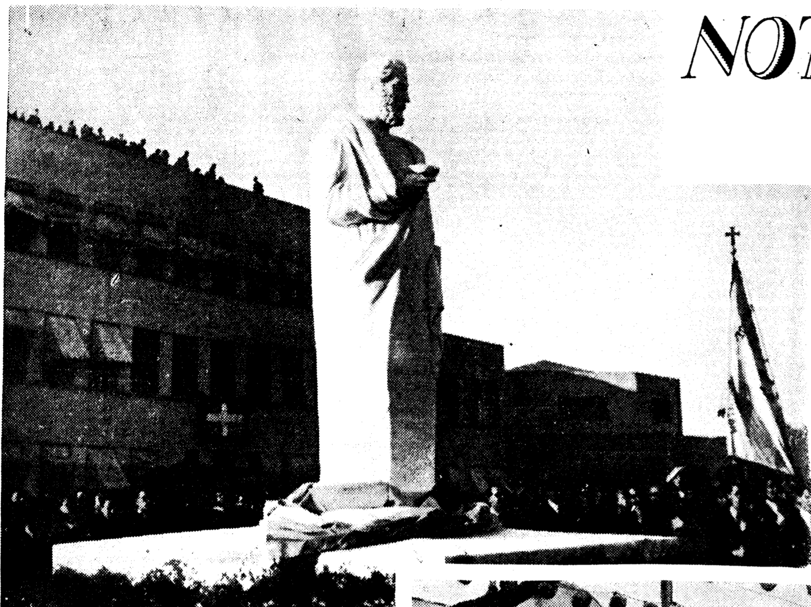
Solemne inauguración de la estatua erigida en Atenas a Hipócrates, el padre de la Medicina, ante los delegados del Congreso Internacional de Patología, celebrado en aquella ciudad