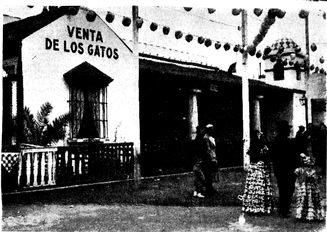
Caseta de la Tertulia del Arenal, que ha obtenido el segundo premio en la Feria de Sevilla. El primer premio ha quedado desierto