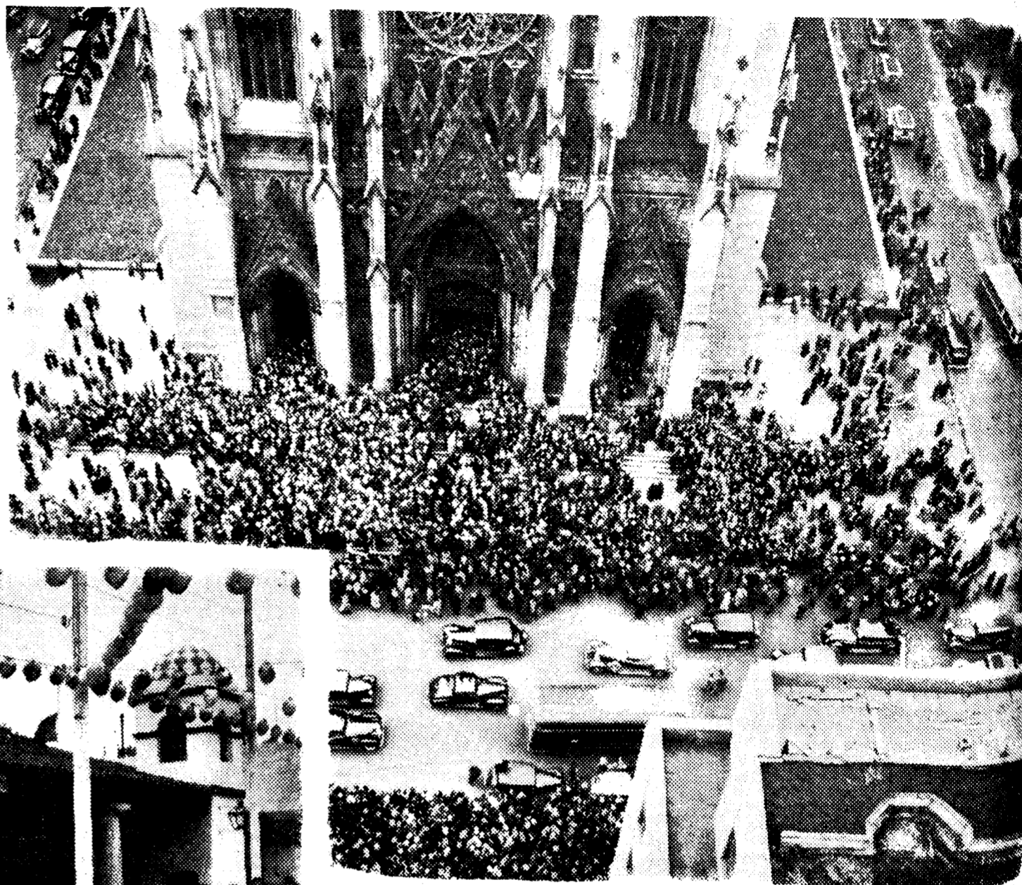
Aspecto que ofrecía el día de Pascua la entrada de la Catedral de San Patricio, de Nueva York. La gran multitud que asistió a las ceremonias religiosas dificultó a la salida el tráfico de la Quinta Avenida. La foto está tomada desde una ventana de la Institución Rockefeller