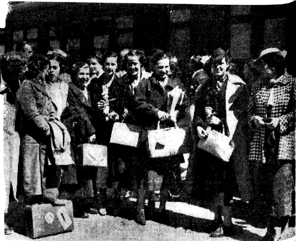
El equipo femenino español de «hockey», que ha participado en el campeonato europeo celebrado en Berlín, a su llegada, ayer por la mañana, a Madrid