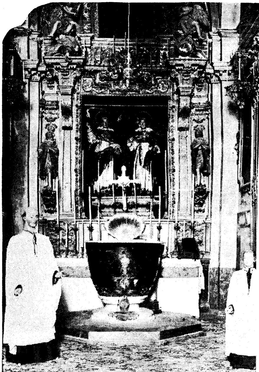
Niños acogidos a la Beneficencia municipal, de Sevilla, tomando la merienda extraordinaria con que han sido obsequiados con motivo de las fiestas de la feria de abril