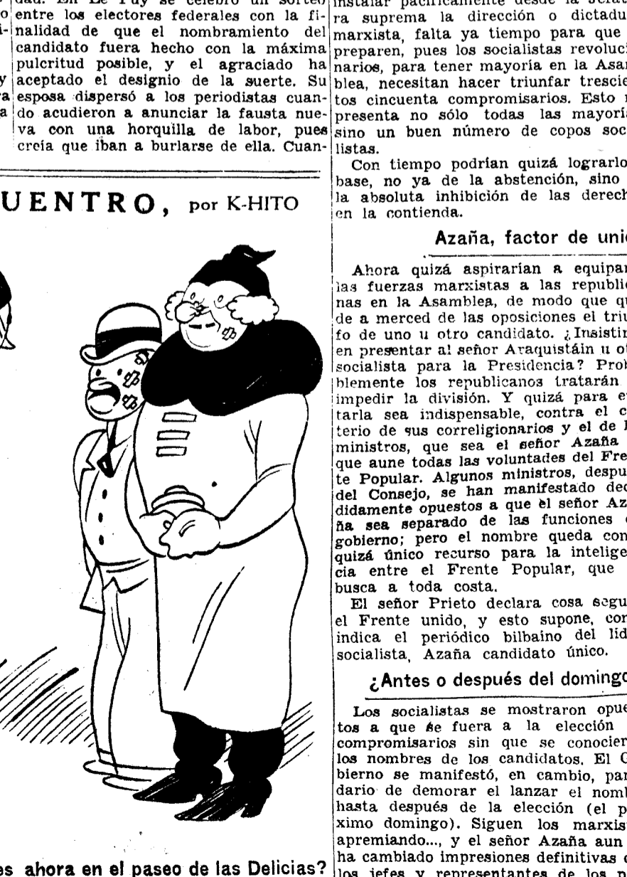
—¿De modo que viven ustedes ahora en el paso de las Delicias? —Convivimos, convivimos nada más.