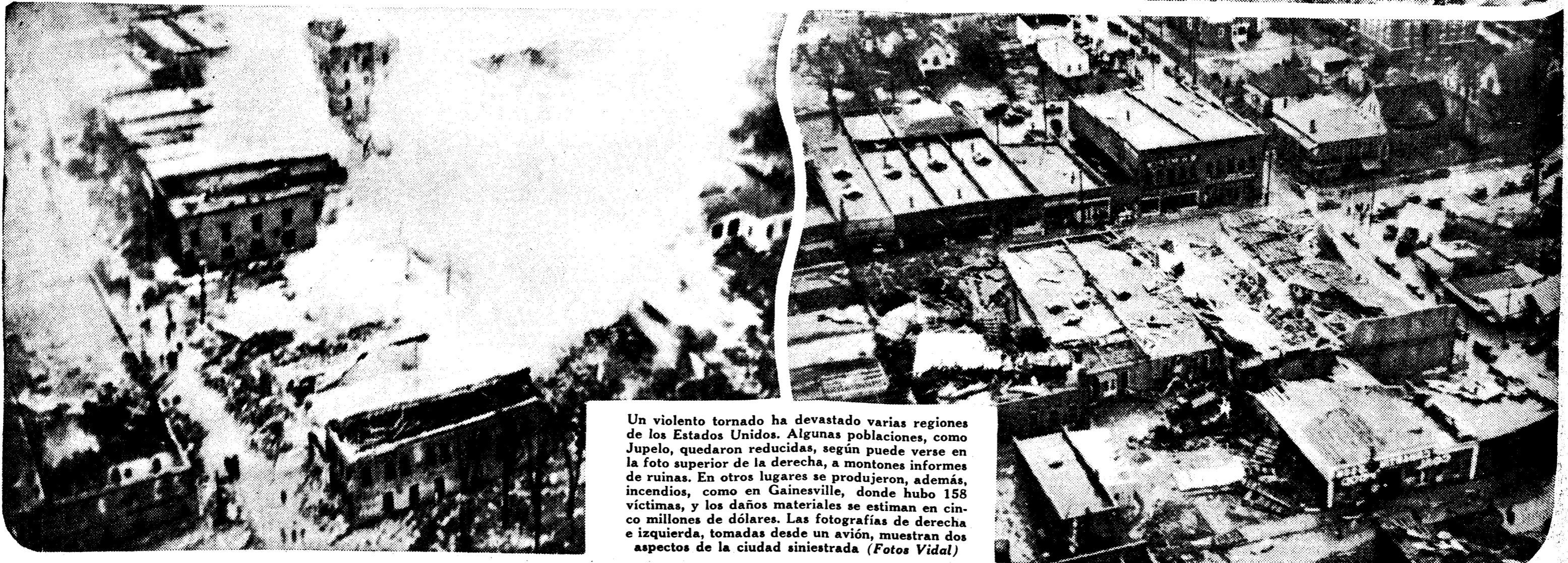
Un violento tornado ha devastado varias regiones de los Estados Unidos. Algunas poblaciones, como Jupelo, quedaron reducidas, según puede verse en la foto superior de la derecha, a montones informes de ruinas. En otros lugares se produjeron, además, incendios, como en Gainesville, donde hubo 158 víctimas, y los daños materiales se estiman en cinco millones de dólares. Las fotografías de derecha e izquierda, tomadas desde un avión, muestran dos aspectos de la ciudad siniestrada