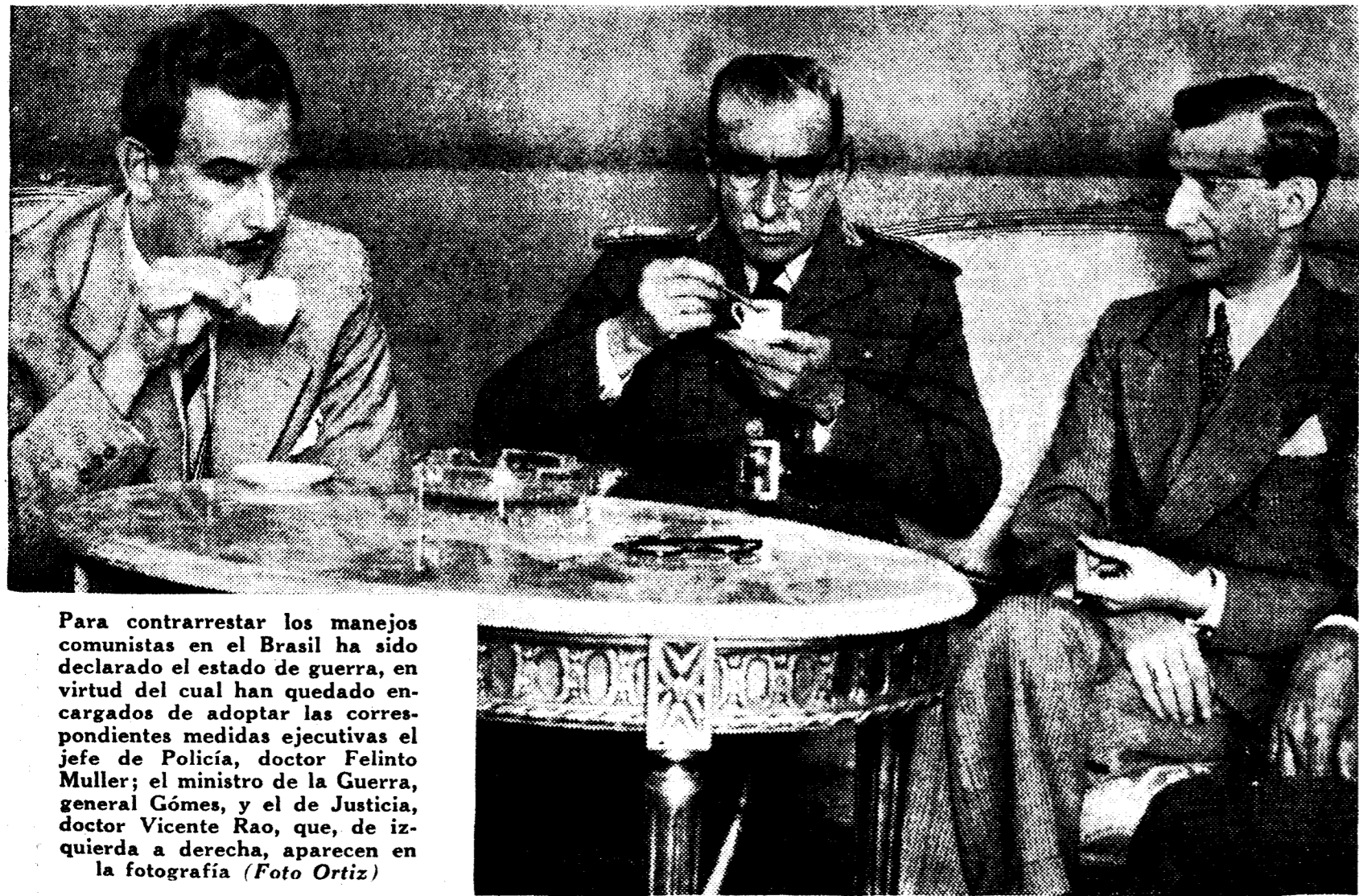
Para contrarrestar los manejos comunistas en el Brasil ha sido declarado el estado de guerra, en virtud del cual han quedado encargados de adoptar las correspondientes medidas ejecutivas el jefe de Policía, doctor Felinto Muller; el ministro de la Guerra, general Gómes, y el de Justicia, doctor Vicente Rao, que, de izquierda a derecha, aparecen en la fotografía