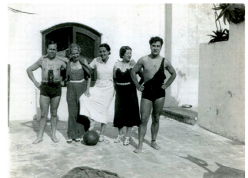
Fig. 3. Aizpurúa, José Manuel: Baños , San Sebastián, 1931.