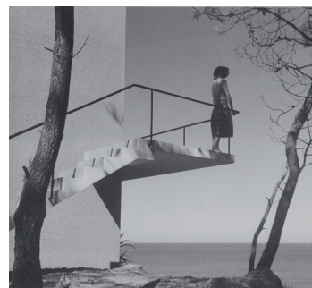
Fig. 8. Autor desconocido: Vivienda La Rincónada, Punta Ballena, Uruguay, 1948.

En definitiva, coincidiendo con los inicios del Movimiento Moderno, la arquitectura descubre por fin a la fotografía y hace de ella una poderosísima aliada. La nueva fotografía se convierte en el medio de difusión de la nueva arquitectura y de las nuevas ideas, que pueden expresarse sin duda mejor gracias al lenguaje propio que una fotografía, no menos moderna, ha alcanzado ya. En una mirada hacia atrás en el tiempo, en busca de los orígenes de esta relación, el profesor Lahuerta nos remite a la época de la Bauhaus de Dessau como desencadenante de “la escalofriante herencia que ha llegado a nuestros días, convertida en exceso fotográfico. Fue el lugar donde más se creyó que la arquitectura y la fotografía podrían amplificar mutuamente sus poderes y virtudes”. (16) De hecho, allí se instaurará la fotografía como asinatura en 1929.