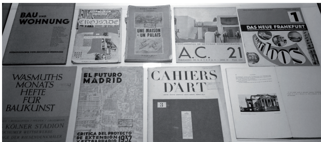
Fig. 1. Portadas de diversas publicaciones nacionales y europeas, 1926-1936.

para el Progreso de la Arquitectura Contemporánea. In its twenty four numbers (1931-1937), the image acquired a very important presence, as it was interested not only in architectural material but was also open to the contributions of photography, cinema and art in general. (3) Before its appearance in 1931, Spanish architectural magazines were limited to Arquitectura and Cortijos y Rascacielos , with a structure and composition far removed from the European models, from which, however, A.C. absorbed a great deal of the style, typography and composition of the German Das Neue Frankfurt (1926-1933). In reality, A.C. was not an architectural magazine in the strict sense. It was the organ of expression of the GATEPAC group, which was determined to change society through architecture and art in general, and whose main tool would be the magazine and the graphical evidence contained within it. (Fig. 1)