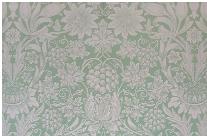
Fig. 4. Morris, William: Wallpaper at the Red House. Ca. 1859.

Marx had famously said: "in a communist society, where nobody has an exclusive sphere of activity but each can become accomplished in any branch he wishes, society [...] makes it possible for me to do one thing today and another tomorrow, to hunt in the morning, fish in the afternoon, rear cattle in the evening, criticize after dinner, just as I have in mind", (5) which further below he applied to the case of artists, less prone to bucolic hobbies, rather in thirst of being freed from "the subordination of the artist to some definite art, thanks to which he is exclusively a painter, sculptor, etc., the very name of his activity adequa-