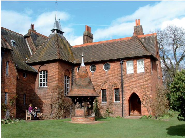
Fig. 3. Webb, Philip; Morris, William: The Red House. Bexleyheath (1859).

In any event, and no matter how misguided their reading was of a text which in fact they could never read given that it was published only in the 1930s, they took it to themselves to chisel their own existence as much as possible as Marx suggested life would one day be: devoted to freely assumed work, but truly freely assumed, not as liberal ideology deceptively presented the sale of one’s work force as an exchange without restrictions. Through this they would realize their full potential as creative beings, assembled together according to their individual (“egoistic”) penchants, and rejoicing in collective enterprises –the furnishing of Morris’s Red House for instance–. (Fig. 3)