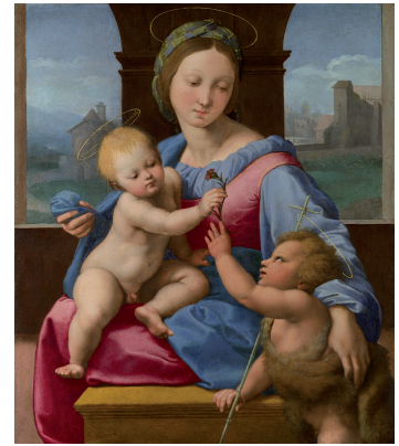
Fig. 2. Raphael: The Garvagh Madonna . Ca. 1509-10. The National Gallery, London, acquired 1865.

Thus art from the Renaissance onwards was a corrupt art, not only due to the closure it had imposed upon the vital bursts proper to preceding centuries, but because it rested on the exploitation of man by man and had finally degenerated into the unimaginative and low-quality goods on show at any International Exhibition and on sale anywhere. In the minds of the Pre-Raphaelites and their circle, William Morris notably, these were inseparable phenomena: it was precisely the alienation of craftsmen and the splitting