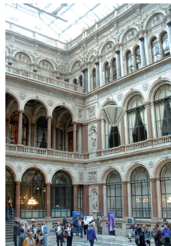
Fig. 1. Scott, Sir George Gilbert: Foreign Office & India House (1868-73). Courtyard, London.

Si tales eran los sentimientos que Rafael despertaba entre los artistas británicos y tal era el juicio que sus obras les merecían desde un punto de vista estrictamente disciplinar, no menos reveladoras de las razones últimas que animaban su veredicto eran las ideas que Marx expresó en La Ideología Alemana , un manuscrito fechado, precisamente, entre 1845 y